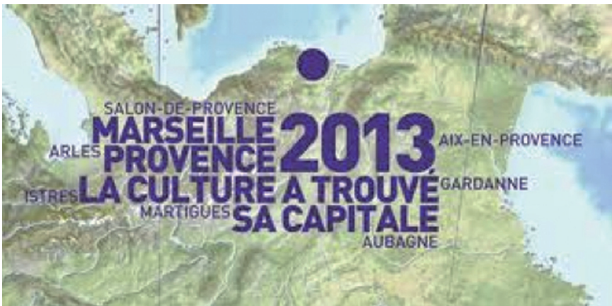
Figure 11 : Le périmètre (carte inversée) de Marseille-Provence 2013 - janvier 2013 (Association Marseille-Provence 2013)

le cas du Pays Cathare 62 . L'action publique serait le produit d'une mobilisation collective, en l'espèce portée par les opérateurs économiques qui sont parvenus