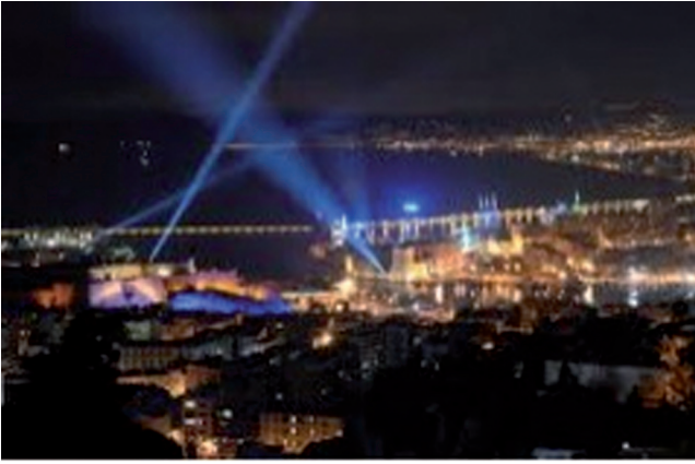
Figure 7 : Photo des nuits de projection « Ma ville accélère »

entrepreneuriales s'accorde mal avec l'observation des logiques de fabrication des marques de ville, produit de l'éclatement des routines bureaucratiques et des capacités organisationnelles.