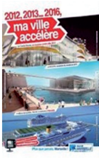
Figure 6 : Affiche « Ma ville accélère » (Mairie de Marseille)

entre des projets qui relèvent de logiques distinctes : un musée national (Musée des civilisations de l'Europe et de la Méditerranée), une salle de spectacle (Silo), les réalisations au sein du périmètre Euroméditerranée, la rénovation du stade Vélodrome ou la semi-piétonnisation du Vieux-Port. Les 14, 15 et 16 février 2011, dans une opération de spectacularisation de la ville 44 , les nuits sont éclairées par des projecteurs braqués sur les sites qui accueilleront les équipements et les manifestations des futurs événements 45 . Certes, l'échéance de la Capitale européenne de la culture (2013) fournit une unité à ces opérations, mais elle ne traduit que faiblement une réflexion stratégique partagée. Ce point fait écho à un postulat de la gouvernance urbaine selon lequel les élites politiques et économiques entretiennent un rapport stratégique à l'action publique au sein d'un système politique local qualifié de « managérial et compétitif » 46 . Or, ce modèle d'élites