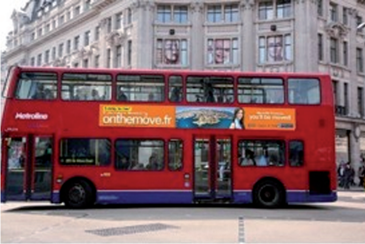
Figure 5 : Affichage de la campagne « Marseille on the move » à Londres

l'Euro de football en 2016, la municipalité lance au printemps 2011 une nouvelle campagne de communication destinée à manifester le changement dans la ville et à contrebalancer les nuisances que génère une ville en chantier. L'objectif stratégique de la campagne consiste à mettre en scène l'interventionnisme des pouvoirs locaux afin de rompre avec les critiques d'immobilisme.