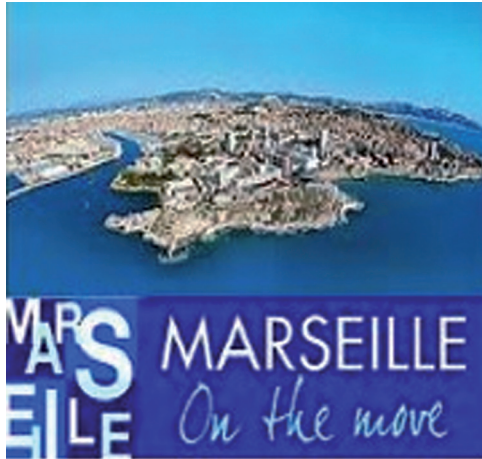
Figure 4 : Logo « Marseille on the move » (Mairie de Marseille)

Devant l'urgence des échéances que constituent les organisations du Forum mondial de l'eau en 2012, de la Capitale européenne de la culture en 2013 et de