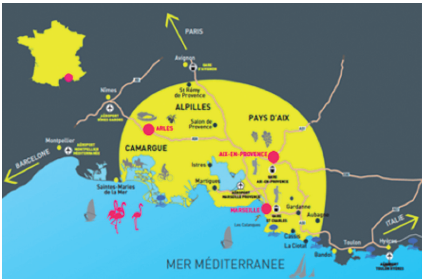
Figure 9 : Le périmètre de Marseille-Provence 2013 - janvier 2011 (après le retrait de la communauté d'agglomération Toulon-Provence-Méditerranée) (association Marseille-Provence 2013)

aux cibles des politiques d'attractivité (touristes, investisseurs, médias nationaux vecteurs d'image), par le contournement des logiques d'acteurs politiques et des fragmentations institutionnelles. Marseille-Provence s'apparente dès lors au « territoire imaginé » décrit par Marie-Carmen Garcia et William Genieys dans