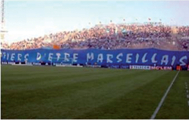
Figure 2 : Stade Vélodrome Virage Sud

saisir des mobilisations et des réalisations informelles afin de mettre en évidence les modes d'appropriations officielles des créativités marketing de « bazar » 35 .