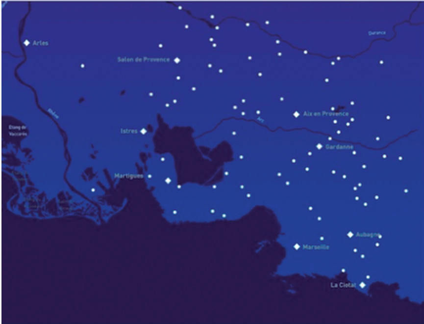
Figure 10 : Le périmètre de Marseille-Provence 2013 - janvier 2012 (association Marseille-Provence 2013)