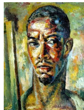
Autoportrait, huile sur toile, 1943