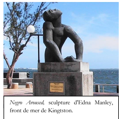
Negro Aroused , sculpture d'Edna Manley, front de mer de Kingston.