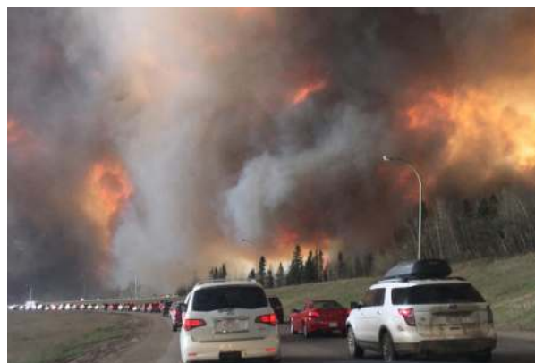
Figure 3. Evacuation de la ville de Fort McMurray (une ville de 80 000 habitants de l'état de l'Alberta au Canada) en Mai 2016

Agir durablement sur le risque incendie, nécessite le rétablissement d'une situation plus proche du régime d'incendie caractéristique d'un écosystème donné et pour cela la réintroduction du feu comme outil de régulation de la biomasse arbustive accumulée au niveau du sol, sous la forme de brûlages dirigés. Comme en sécurité incendie dans les bâtiments, la réduction de la biomasse représente en effet le seul élément du triangle du feu (Figure 1) sur lequel il est possible d'agir pour réduire durablement le risque incendie. Concernant la sécurité des biens et des personnes, comme pour d'autres risques naturels (inondation, submersion), il sera difficile de ne pas revoir les conditions qui ont conduit à urbaniser certaines zones, en évitant par exemple les situations de mitage (habitats dispersés en milieu naturel) qui compliquent considérablement les conditions d'interventions des pompiers et des forestiers. Dans les régions où le niveau de risque est particulièrement élevé, il faudrait également imaginer des architectures innovantes qui permettraient de réduire le niveau de vulnérabilité des habitations, en particulier dans le traitement des toitures et des ouvertures.