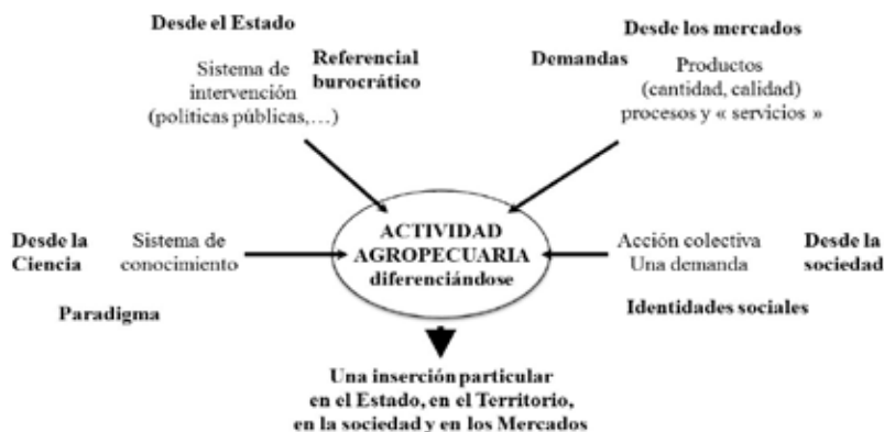
Figura 5: Un modelo de desarrollo es una cuádruple convergencia

Estos modelos son emergentes y como tales son incompletos, inacabados. Esa propiedad de “incompletud” no es el resultado de un estado de transición de un territorio a otro según el concepto de de/re-territorialización de un geógrafo como Claude Raffestin (1987). Parece definir más bien un estado inestable pero prolongado, permanentemente en cambio y con modelos que, aunque ni siquiera bien definidos, ya están en disputa. Lo llamé una “territorialización incompleta” con la finalidad de llevar el foco de atención de los