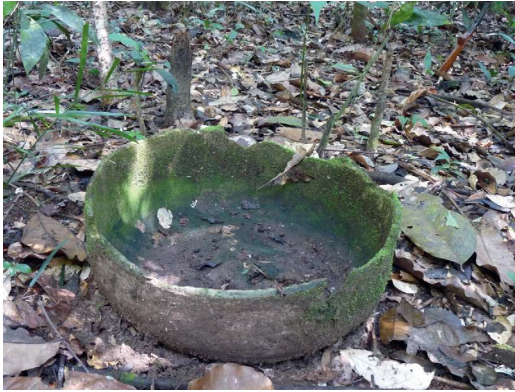
Photo 1. Pot en terre cuite retrouvé à proximité du castanhal Ponta do Jaraí