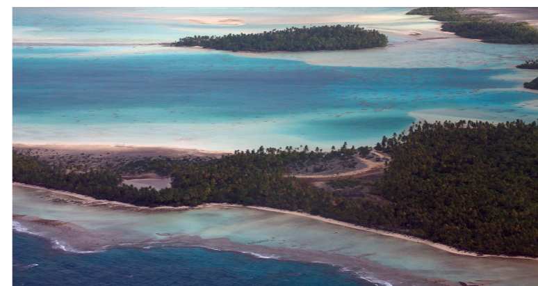
Fig. 2 – Les îles coralliennes de l'atoll de Rangiroa, Tuamotu, Polynésie Française, dans le secteur du lagon bleu. Ces îles naturelles sont bien alimentées en sédiments par le récif, comme le montre le nappage sédimentaire du platier récifal. De telles îles ont la capacité de s'élever pour suivre l'élévation du niveau de la mer. ■

à partir de quand et comment se manifestera l'impact de l'élévation du niveau de la mer ? En quoi les facteurs anthropiques sont-ils susceptibles d'influencer l'évolution future de ces îles ? L'élévation du niveau de la mer, parce qu'elle s'accélère et se combine avec le réchauffement et l'acidification des eaux océaniques préjudiciables à la santé des coraux, aura, au-delà d'un certain seuil (encore inconnu), des effets négatifs sur l'évolution des îles. Là où les coraux mourront et où le récif sera érodé par les vagues, celles-ci ne seront plus alimentées en sédiments. L'érosion des récifs morts, cumulée à l'élévation du niveau de la mer, accroîtra la hauteur du plan d'eau, ce qui aura pour effet de renforcer l'impact érosif des vagues de tempête et la fréquence des submersions marines.