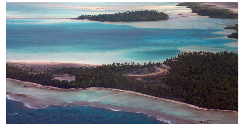
Fig. 2 – Les îles coralliennes de l'atoll de Rangiroa, Tuamotu, Polynésie Française, dans le secteur du lagon bleu. Ces îles naturelles sont bien alimentées en sédiments par le récif, comme le montre le nappage sédimentaire du platier récifal. De telles îles ont la capacité de s'élever pour suivre l'élévation du niveau de la mer. ■

à partir de quand et comment se manifestera l'impact de l'élévation du niveau de la mer ? En quoi les facteurs anthropiques sont-ils susceptibles d'influencer l'évolution future de ces îles ? L'élévation du niveau de la mer, parce qu'elle s'accélère et se combine avec le réchauffement et l'acidification des eaux océaniques préjudiciables à la santé des coraux, aura, au-delà d'un certain seuil (encore inconnu), des effets négatifs sur l'évolution des îles. Là où les coraux mourront et où le récif sera érodé par les vagues, celles-ci ne seront plus alimentées en sédiments. L'érosion des récifs morts, cumulée à l'élévation du niveau de la mer, accroîtra la hauteur du plan d'eau, ce qui aura pour effet de renforcer l'impact érosif des vagues de tempête et la fréquence des submersions marines.