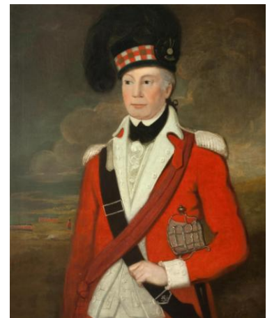
Le Major Duncan McPherson, 71 e régiment des Fraser Highlanders. Anonyme, vers 1776, National War Museum, Édimbourg.

Cette différence est soulignée dans la presse londonienne, qui est largement copiée par la presse coloniale. De part et d'autre de l'Atlantique, on diffuse l'image d'une Écosse ennemie des libertés car marquée par le jacobitisme. La forte présence des Highlanders dans l'armée du roi est en outre interprétée comme un signe révélateur de l'hostilité des Écossais envers l'Amérique.