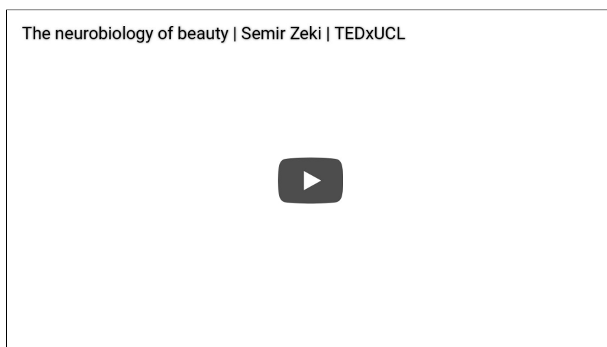
The neurobiology of beauty, Semir Zeki

Pour les fondateurs de l'esthétique cognitive, les comportements esthétiques ont révélé dès le départ la réunion savante des sciences cognitives et des connaissances en matière d'art. Gibson 1 a associé les pratiques de l'art à la perception et à la représentation mentale de l'espace environnemental, Arnheim 2 les a rattachées aux fonctions supérieures de la production du sens de l'objet culturel et de la construction de son axiologie. Le but partagé de ces deux démarches a été de sortir les études de l'art de la scientificité « molle » et de leur donner des assises solides, sans tomber dans les travers du scientisme positiviste. L'apparition des sciences cognitives au début des années 1960 a donné l'occasion de réaliser l'ancien projet de Wolflin 3 et de Riegl 4 d'accomplir ce périlleux exploit épistémologique : la sphère la plus subjective et individuelle de tous les comportements humains a pu être appréhendée dans la même visée que l'inscription écologique du sujet humain en général.