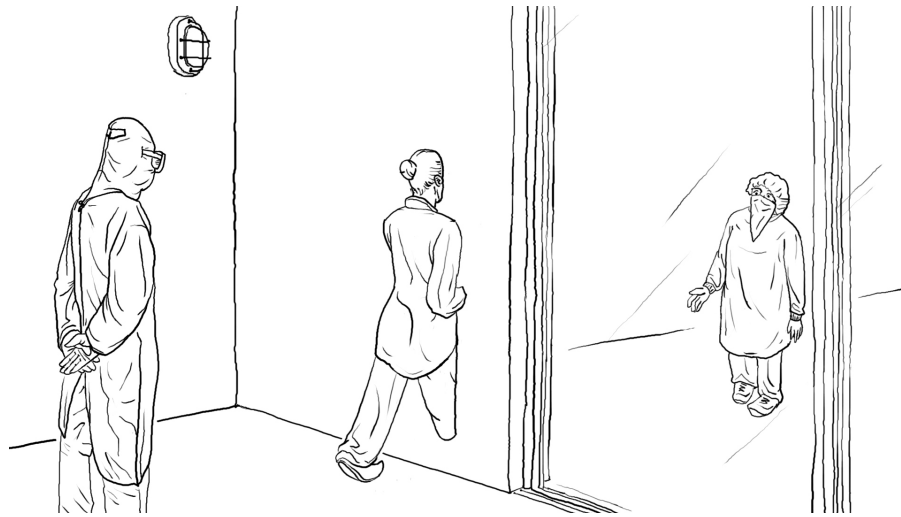
2035. L'analyse rigoureuse des phénomènes magiques met en échec les théories classiques, préparant le terrain pour l'émergence d'un nouveau paradigme.