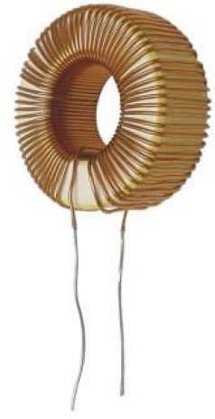
FIGURE 3 – Les deux phénomènes sont modélisés dans la même langue mathématique, dans deux cadres théoriques bien distincts (hydrodynamique et électromagnétisme). A gauche, l’expression de la vitesse de propagation du rond de fumée ( d\mathbf{V} , en gras pour indiquer que cette quantité est un vecteur et contient des informations sur la direction de propagation) en fonction de la taille r de l’anneau et de la vitesse \Gamma d\mathbf{l} avec laquelle il tourne sur lui-même. A droite, l’expression du champ magnétique d\mathbf{B} créé par une bobine circulaire, en fonction du rayon r de la bobine, du courant électrique d\mathbf{C} qui la parcourt et d’une constante universelle \mu_0 . La similitude de la forme mathématique caractérisant chacun des phénomènes permet d’établir une analogie entre eux. Les deux expressions sont en effet très proches ; remarquez en particulier le rôle de la position notée r : dans les deux cas apparaît la forme \times \mathbf{r}/r^3 , qui caractérise à la fois la direction et la dépendance spatiale de la grandeur décrite par l’équation. A partir de cette similitude de forme, on peut associer une à une les grandeurs du modèle de gauche à celles du modèle de droite : la vitesse de propagation du vortex ( d\mathbf{V} ) apparaît comme le champ magnétique créé par la spire ( d\mathbf{B} ), la circulation de la fumée ( \Gamma d\mathbf{l} ) correspond à un élément de courant électrique ( d\mathbf{C} ) etc.

de traduire les propriétés de l’un dans le langage de l’autre, et de mobiliser ainsi la connaissance acquise sur un système au profit de l’étude du second.