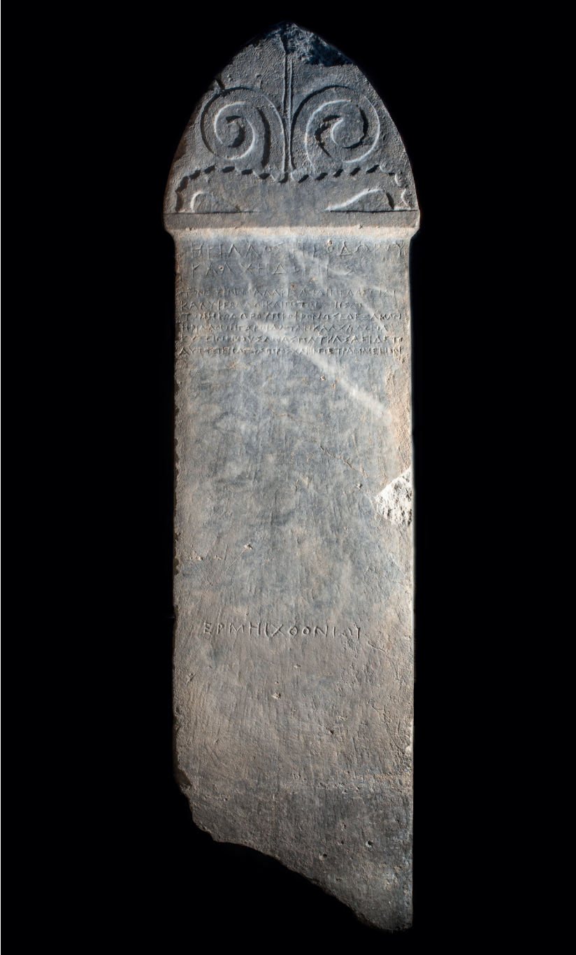
Fig. 1. Stele per Herillos (Foto di Giorgos Bisbikis – Per gentile concessione dell'Eforia delle Antichità di Larisa).