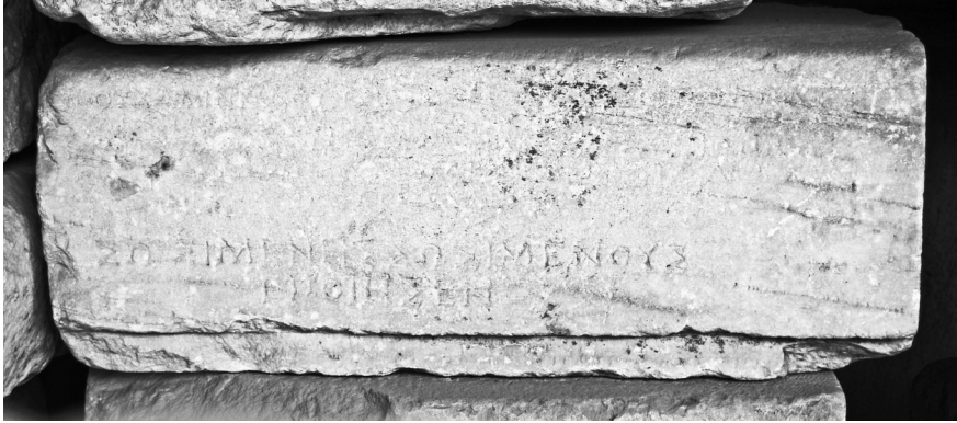
Fig. 3 – Épigramme signée par Héraclidès de Tralles.

Archives GHW 2291. Estampage: TH03393. Photographie (Fig. 3).