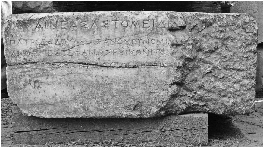
Fig. 2 – Épigramme à Ainéas, signée par Aphthonétos.

Archives : GHW 6115. Estampage : TH03091. Photographie (Fig. 2).