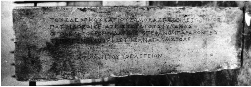
Fig. 1 – Épigramme à Athèna Polias, signée par Aphthonetos.

Datation : on placerait ce texte vers le milieu du III e s. av. J.-C. d'après l'écriture.