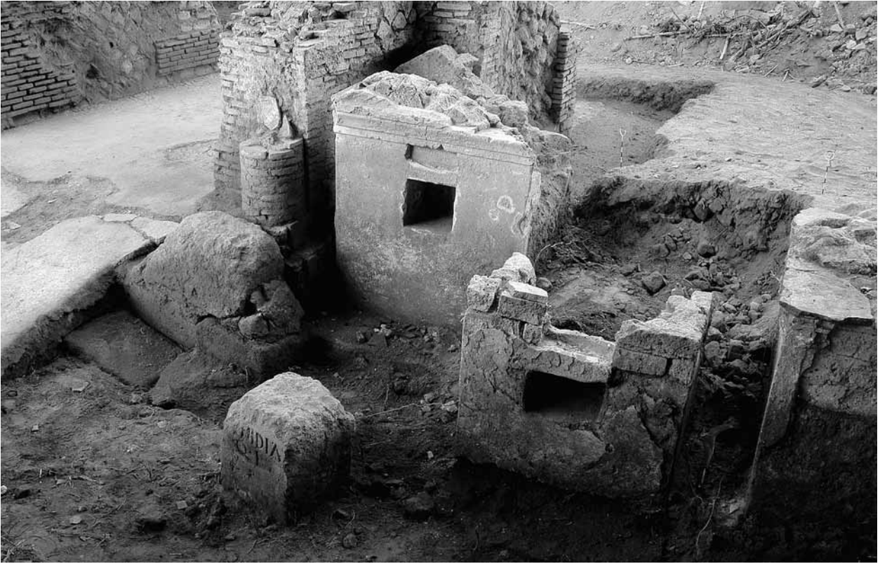
Fig. 28 – Cumes. Secteur D, les monuments funéraires des affranchis.