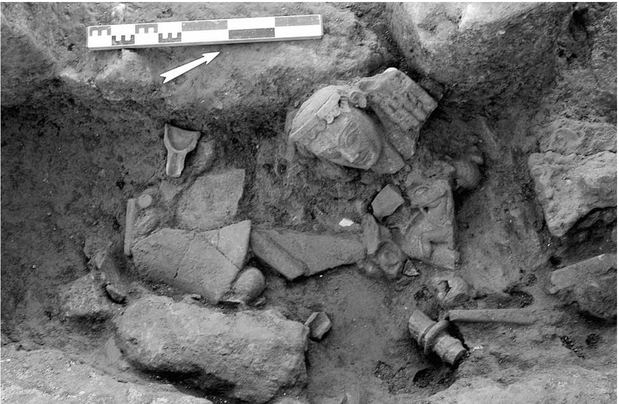
Fig. 26 – Cumés. Sanctuaire suburbain. Détail de la fosse, faisant fonction de favissa.