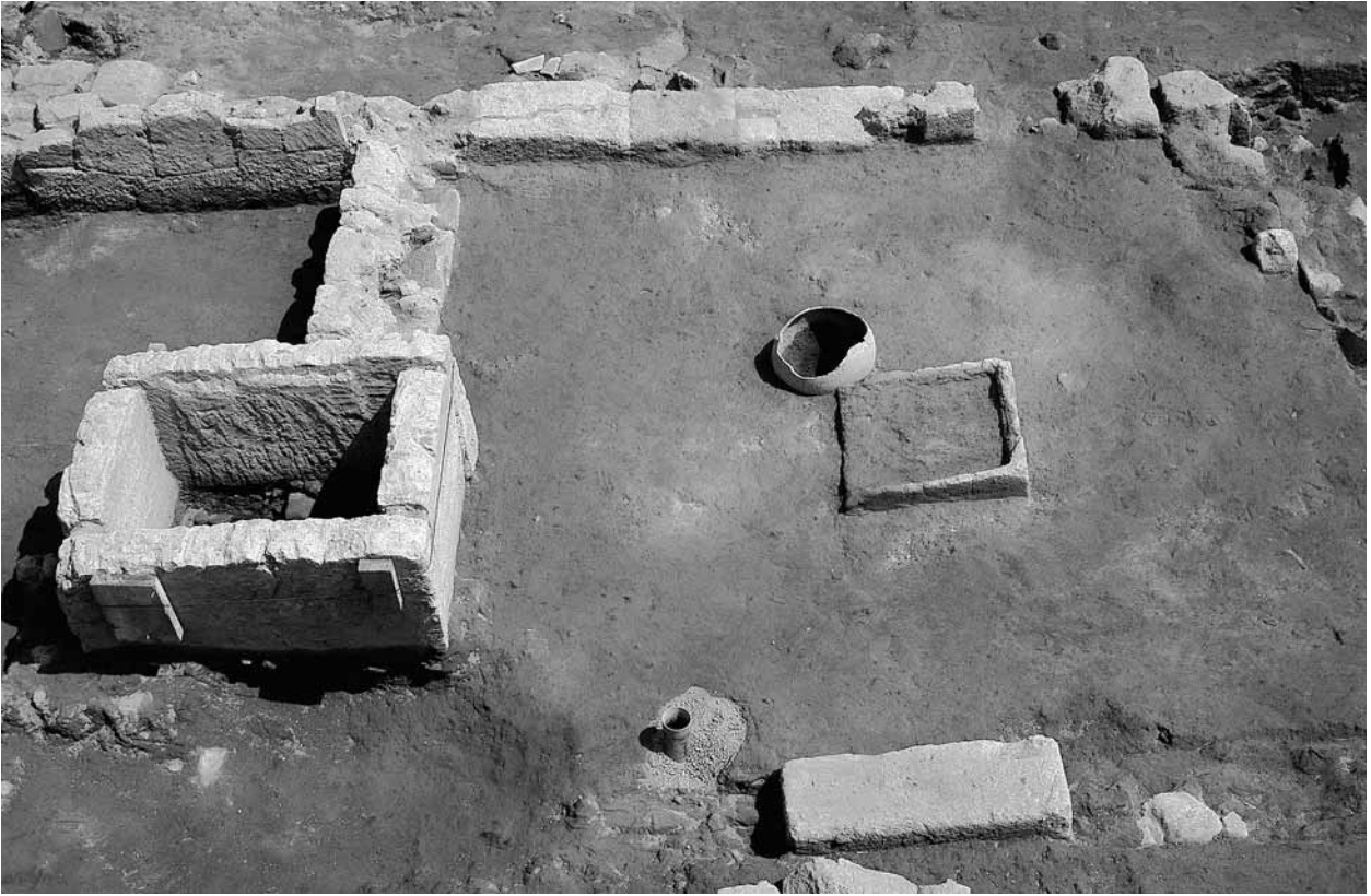
Fig. 25 – Cumés. Vue générale du sanctuaire suburbain.