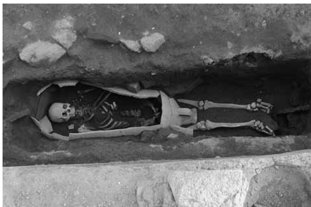
Fig. 31 - Cumès. Une tombe à inhumation dans amphore de Tripolitaine, creusée dans le trottoir de la Via Domitiana (Secteur A;).