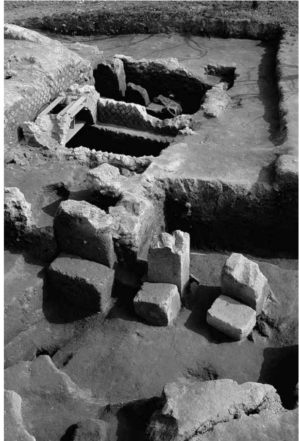
Fig. 30 – Cumes. Vue générale de la zone de la nécropole du Secteur E.