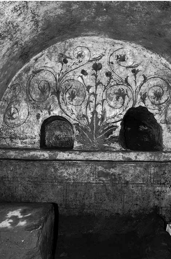
Fig. 29 – Cumes. Peinture décorant l'intérieur du mausolée D50.