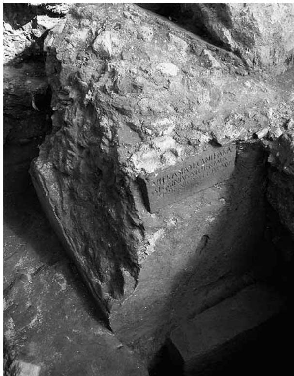
Fig. 27 - Cumes. Le tombeau de Vitrasia Canthara.

D'autres monuments sont construits plus au sud au cours des II e et III e siècles, puis le secteur devient une décharge : les monuments sont progressivement ensevelis sous les immondices, ossements d'animaux, amphores et vaisselle brisée. Il retrouve une fonction funéraire durant l'Antiquité tardive, époque durant laquelle sont aménagées plusieurs tombes à inhumation