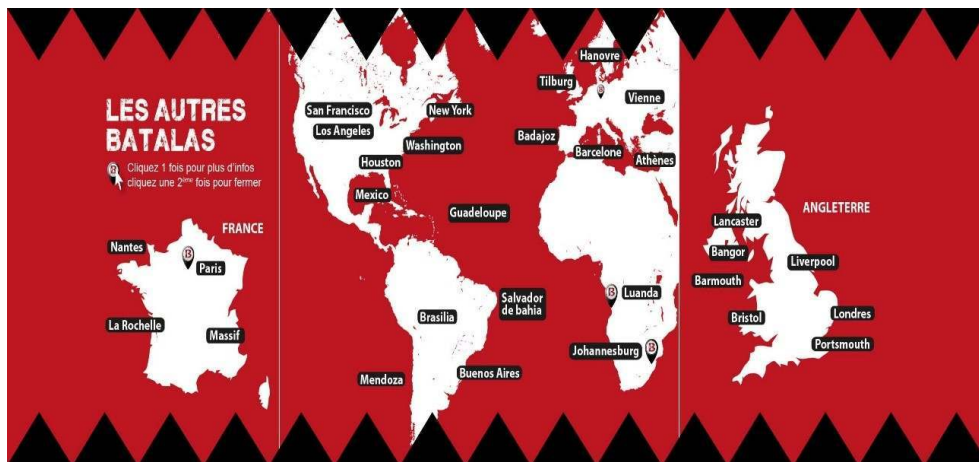
Figure 4 : Distribution géographique de la Batucada Batalá.