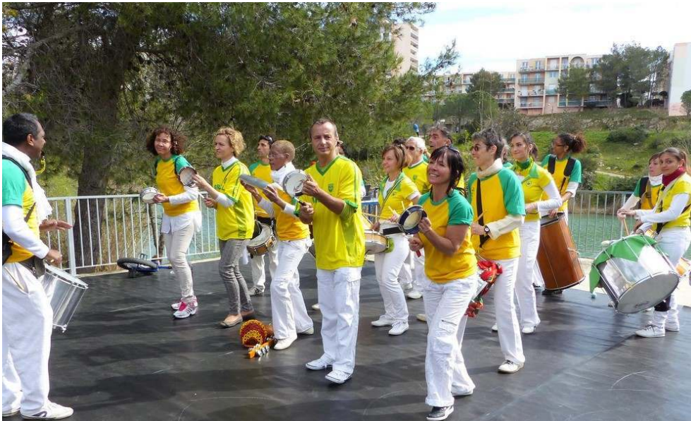
Figure 5 : Batucada d'Arte Cabloca, Montpellier - France.