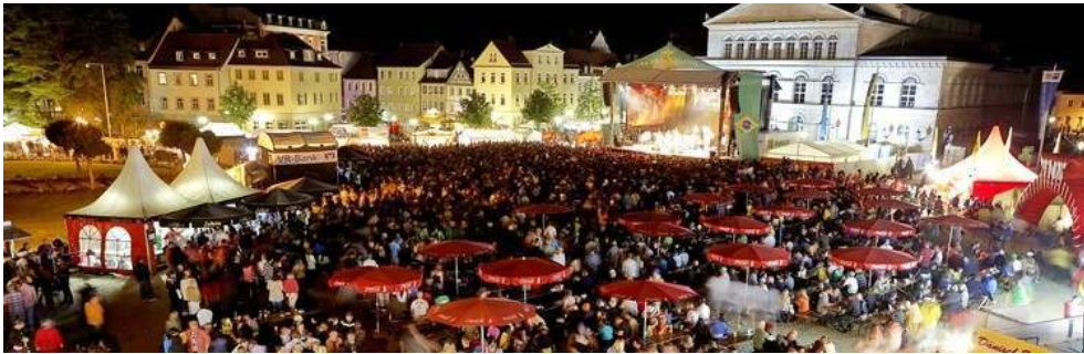
Figura 2 : Samba-Festival à Coburg - Allemagne.