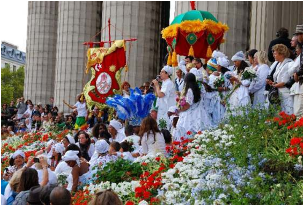
Figure 3 : Fête Lavage de la Madeleine à Paris – France.