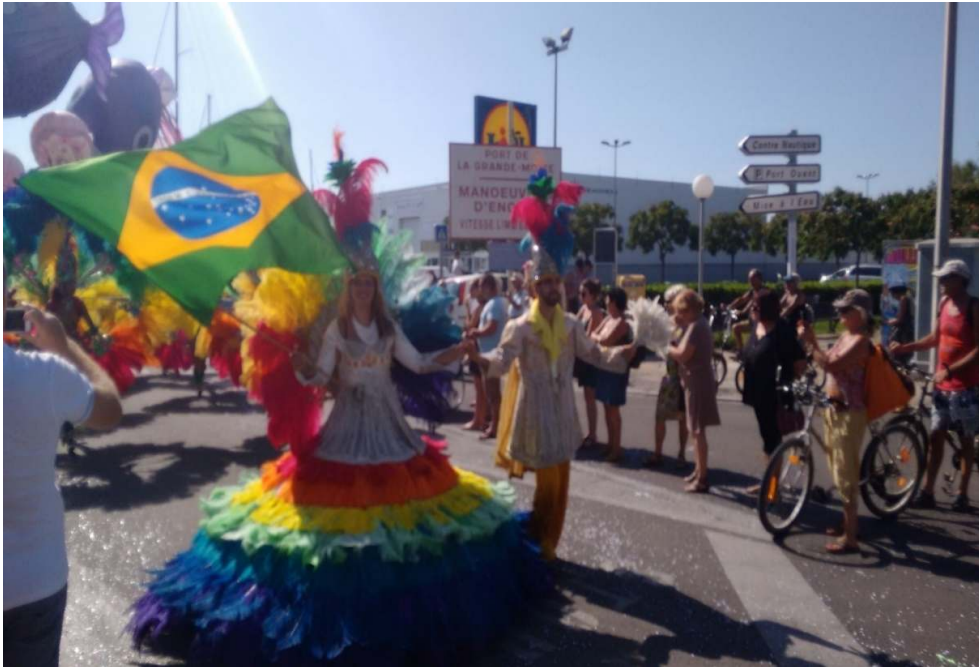
Figure 1: Carnaval de La Grande Motte – France.

Photo prise par Alessandro Dozena, août 2015.