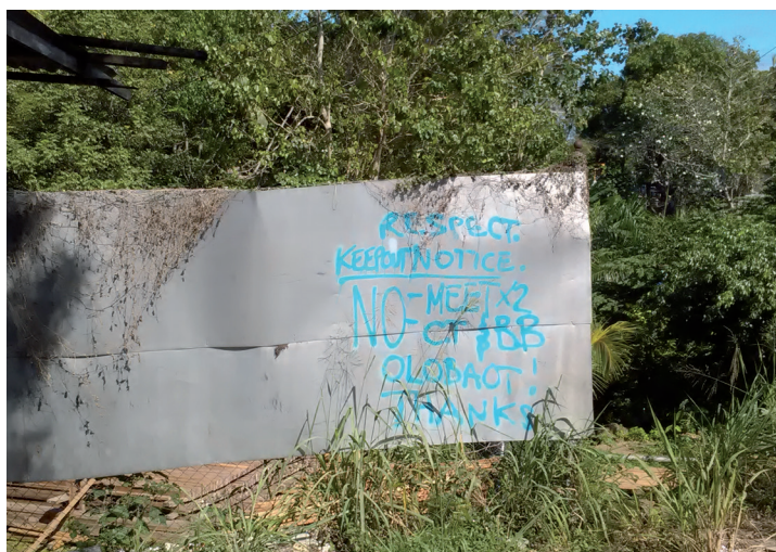
PHOTO 10. – Graffiti demandant qu'on respecte les lieux, Honiara, 2016

Si certains jeunes ne peuvent contribuer beaucoup aux coffres de leur famille, la musique leur permet toutefois d'être appréciés et de devenir célèbres. De façon similaire, la participation et l'intérêt qu'ils manifestent pour les sports d'équipe permettent aux jeunes de s'unir dans de nouveaux réseaux urbains et d'en retirer un peu d'honneur masculin.