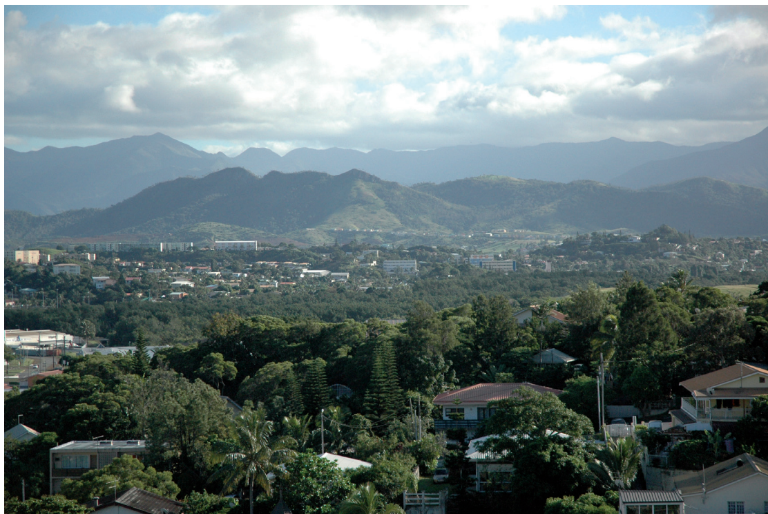
PHOTO 14. – Vue de Nouméa depuis Haut-Magenta vers Magenta, 2007