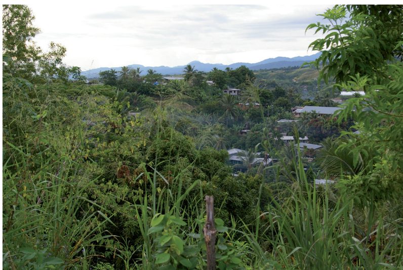
PHOTO 4. – Fulisango, la banlieue résidentielle d'Honiara au sud, 2016

Si les relations et le sentiment d'appartenance au village sont particulièrement durables, il est possible qu'ils s'affaiblissent avec la troisième et la quatrième génération de citadins nés en ville, dont plusieurs sont nés de père et de mère qui proviennent de communautés et de groupes linguistiques différents. Alors que de plus en plus de