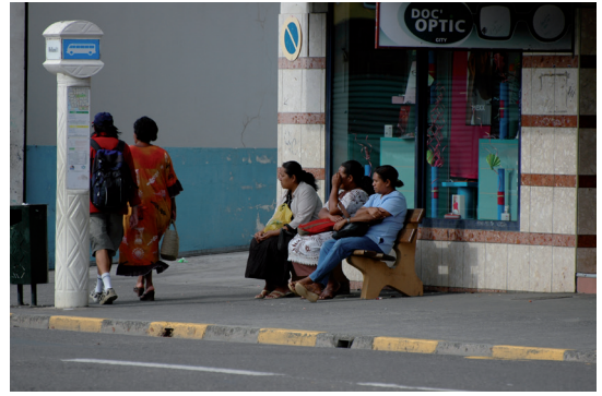
PHOTOS 8-9. – Attente du bus au centre ville de Nouméa, 2007

téléphones intelligents, à l'achat de crédits téléphoniques et aux recharges électriques. Lipset (ce numéro, pp. 195-208) examine comment les téléphones portables à Wewak (Papouasie Nouvelle-Guinée), permettent aux « groupes domestiques de coordonner leur action » et aux membres de la famille de suivre mutuellement leurs vies et d'organiser leurs projets. De façon similaire, les jeunes musiciens de Port-Vila utilisent aussi les téléphones portables pour créer des réseaux urbains (Stern, ce numéro, pp. 117-130). Brison (ce numéro, pp. 209-220) remarque l'importance récente de facebook (consulté principalement sur les téléphones portables) chez les Fidjiens de la classe moyenne. Ce média social, selon l'auteure, est devenu « une composante importante des relations de parenté fidjienne car il facilite les communications et augmente la capacité à rester en contact avec les réseaux bilatéraux de parents éloignés ».