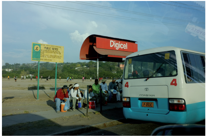
PHOTO 12. – Arrêt de bus, fin de journée, Port Moresby, 2011

« La vie urbaine est encore reliée à la vie des villages par un flot d'informations et de gens qui font l'aller et retour entre les deux. De plus, la vie urbaine est