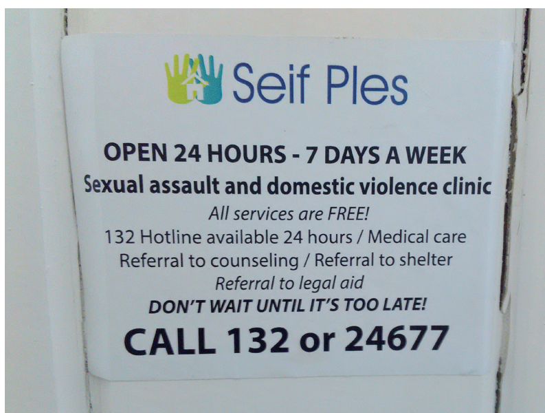
PHOTO 7. – Affiche d'information (trouvée dans les toilettes d'un restaurant d'Honiara) sur le refuge pour femmes Seif Ples , Honiara, 2016

milles à cultiver leurs racines villageoises, même si certains ont, en réalité, renoncé à leurs liens de parenté ou affirment l'avoir fait (Gewertz et Errington, 1999 ; voir aussi Brison, ce numéro, pp. 209-220).