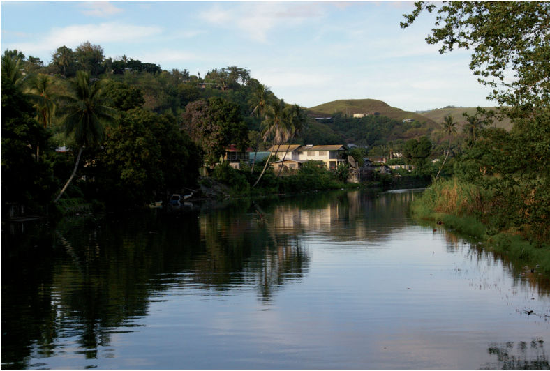
PHOTO 3. – Chinatown d'Honiara vue de la rivière Mataniko, 2007