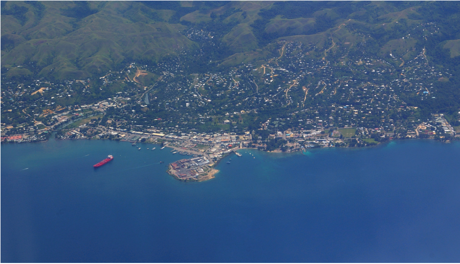
PHOTO 1. – Vue aérienne d'Honiara, février 2008

éprouvent de la nostalgie (Frazer, 1981 ; Jourdan, 1994 ; Zimmer-Tamakoshi, 1996 ; Rousseau, ce numéro, pp. 37-50 ; Petrou et Connell, ce numéro, pp. 51-62). D'autres, qui ont fait de la ville leur demeure, ne veulent absolument pas retourner dans ces villages qu'ils ont fuies et, pour un nombre toujours croissant d'individus nés en ville, à un mode de vie qu'ils n'ont jamais connu.