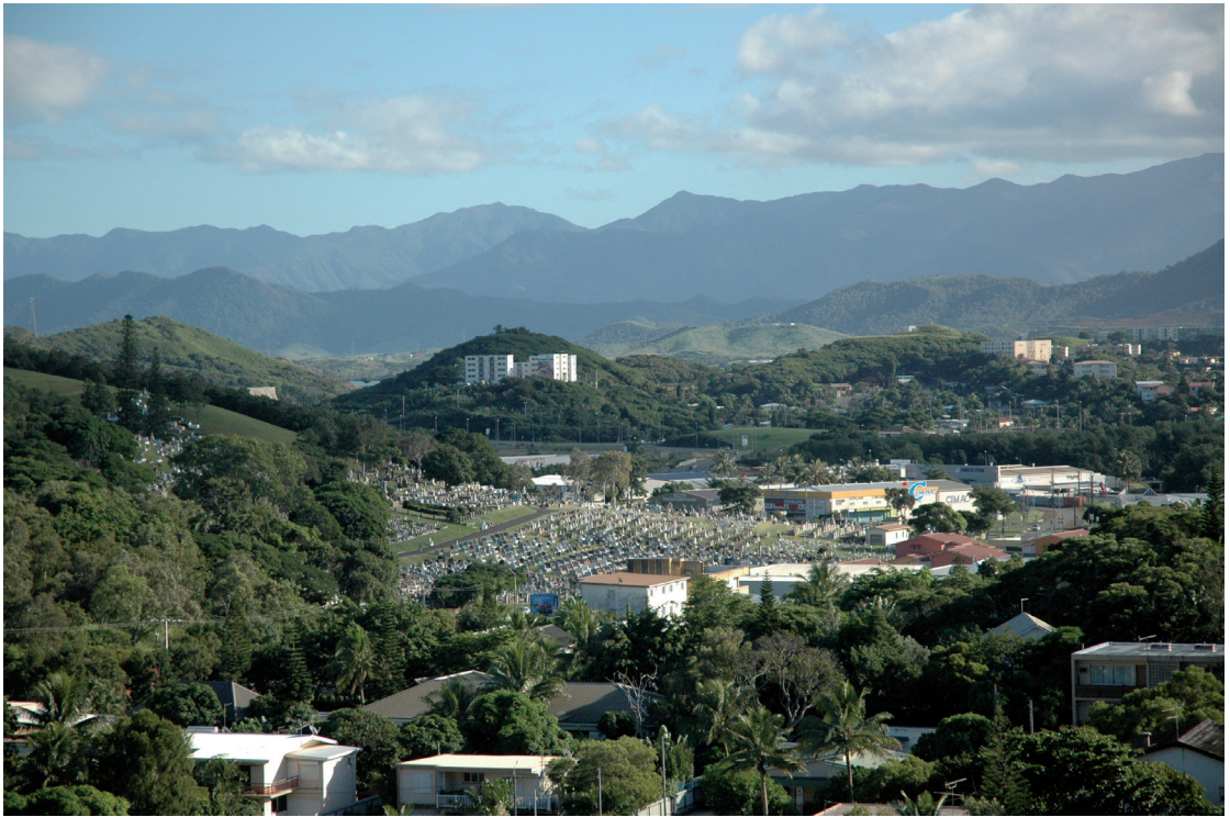
PHOTO 13. – Vue de Nouméa depuis le Haut-Magenta, au-dessus du cimetière du 4 e km, 2007

et saisiront l'occasion d'apprendre, au moins minimalement, les langues et les coutumes de leurs parents en réalisant ce qu'ils perdent. Des indices en provenance de Nouméa, de Vila, de Moresby et d'Honiara pointent dans la direction d'une perte des langues ancestrales parmi les citadins de troisième génération. Les villes mélanésiennes sont peut-être, en fin de compte, un terminus et un piège, mais elles – également – comme les articles de ce numéro le montrent – des endroits captivants, dynamiques et toujours stimulants.