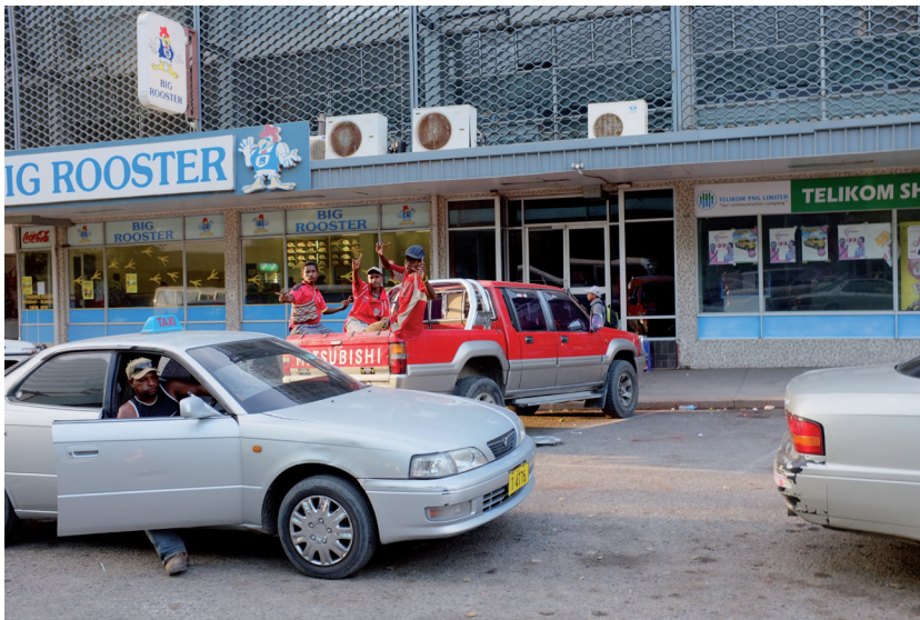
PHOTO 11. – Fin de journée, Port Moresby, novembre 2011

Les citadins sont aujourd'hui bien au-delà de ce seuil, occupés qu'ils sont à créer des cultures urbaines mélanésiennes dynamiques. Celles-ci reflètent les relations translocales durables par le biais desquelles le village façonne la ville et la ville influence le village. Les forces et les manières mondiales s'infiltrent également dans les villes mélanésiennes, portées par la téléphonie mobile et le tourisme international. Comme C. Spark (ce numéro, pp. 147-158) l'explique, la culture urbaine est le reflet des possibilités de nouvelles formes de consommation matérielle, en particulier pour les familles aisées. Les contributeurs à ce numéro explorent la façon dont les villes deviennent des incubateurs de styles nouveaux – linguistiques, musicaux, architecturaux et vestimentaires. Cela est dû en grande partie à la créativité des jeunes citadins qui, en lien avec leurs pairs, inventent des stratégies pour faire face aux défis translocaux et aux attentes contraignantes de leurs familles.