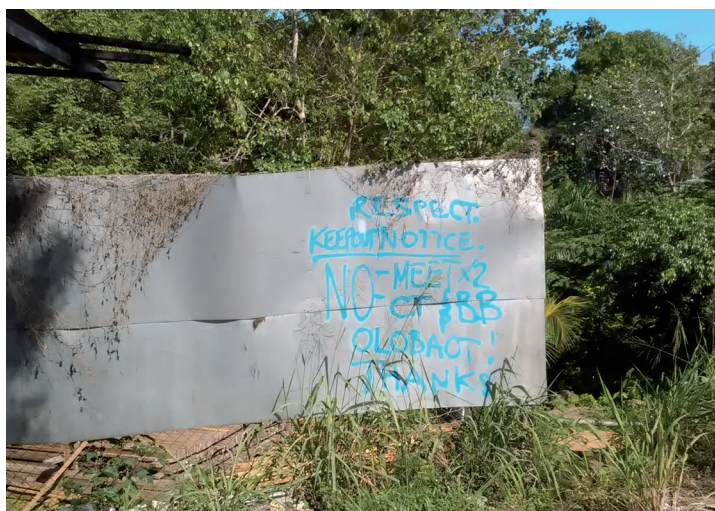
PHOTO 10. – Graffiti demandant qu'on respecte les lieux, Honiara, 2016

Si certains jeunes ne peuvent contribuer beaucoup aux coffres de leur famille, la musique leur permet toutefois d'être appréciés et de devenir célèbres. De façon similaire, la participation et l'intérêt qu'ils manifestent pour les sports d'équipe permettent aux jeunes de s'unir dans de nouveaux réseaux urbains et d'en retirer un peu d'honneur masculin.