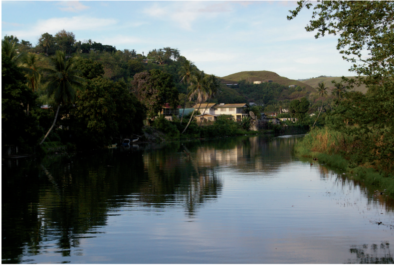
PHOTO 3. – Chinatown d'Honiara vue de la rivière Mataniko, 2007