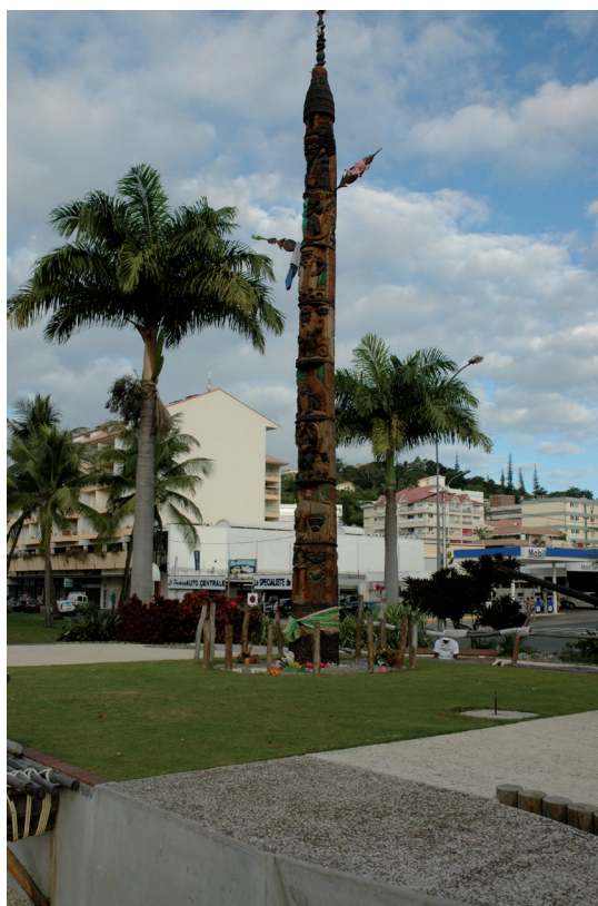
PHOTO 15. – Le mwaka au centre ville de Nouméa, 2007

MORAUTA Louise and Dawn RYAN, 1982. From Temporary to Permanent Townsmen: Migrants from Malalaua District, PNG, Oceania 53 (1), pp. 39-55.