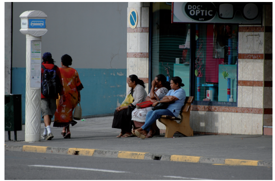
PHOTOS 8-9. – Attente du bus au centre ville de Nouméa, 2007