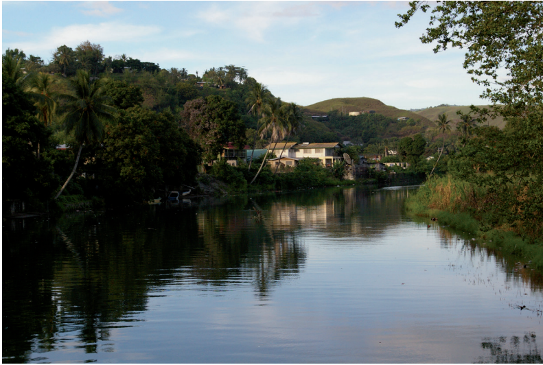
PHOTO 3. – Chinatown d'Honiara vue de la rivière Mataniko, 2007