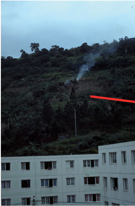
PHOTO 5. – Jardins autour de la cité Pierre Lenquète, quartier populaire périphérique de Nouméa, 1985

Toutes les collines surplombant ces HLM sont occupées par les habitants kanak ou océaniens pour y faire des jardins afin d'améliorer leur quotidien