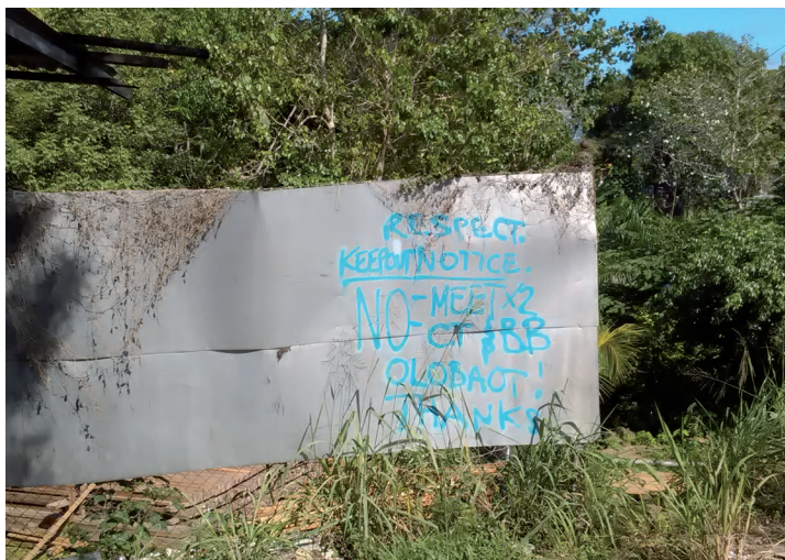
PHOTO 10. – Graffiti demandant qu'on respecte les lieux, Honiara, 2016

Si certains jeunes ne peuvent contribuer beaucoup aux coffres de leur famille, la musique leur permet toutefois d'être appréciés et de devenir célèbres. De façon similaire, la participation et l'intérêt qu'ils manifestent pour les sports d'équipe permettent aux jeunes de s'unir dans de nouveaux réseaux urbains et d'en retirer un peu d'honneur masculin.