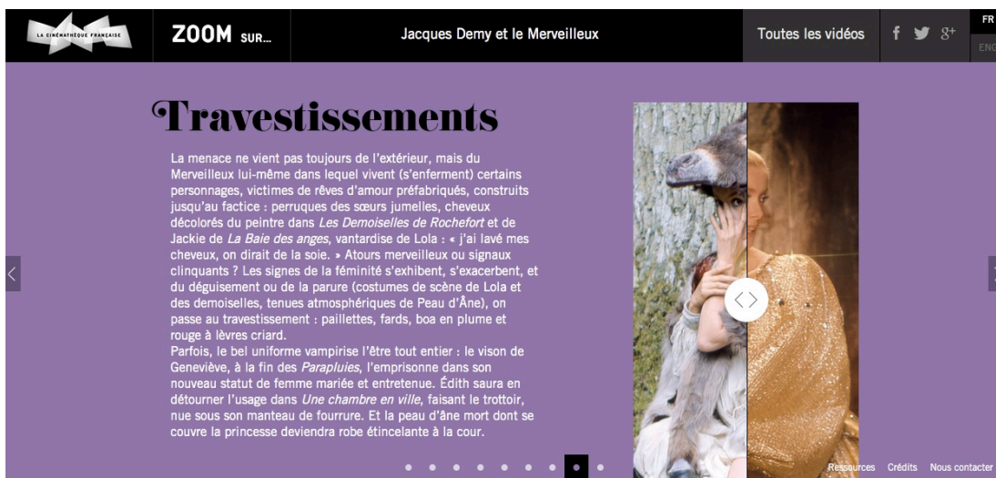
Figure 2 : Illustration Peau d'Âne , Demy et le Merveilleux : page « Travestissements »

Corrélés avec un texte, photos et photogrammes participent cette fois-ci de la construction du discours, comme c'est le cas dans le chapitre « Travestissement ». On y observe deux clichés de Peau d'Âne , l'une dans une peau et l'autre dans une robe. Le spectateur a la possibilité de faire « glisser » une photo sur l'autre créant un effet de superposition, ou une photographie s'efface au profit de l'autre, ce qui a pour conséquence de confronter la vie réelle des personnages à leurs rêves les plus enfouis, révélant ainsi toute leur dualité.