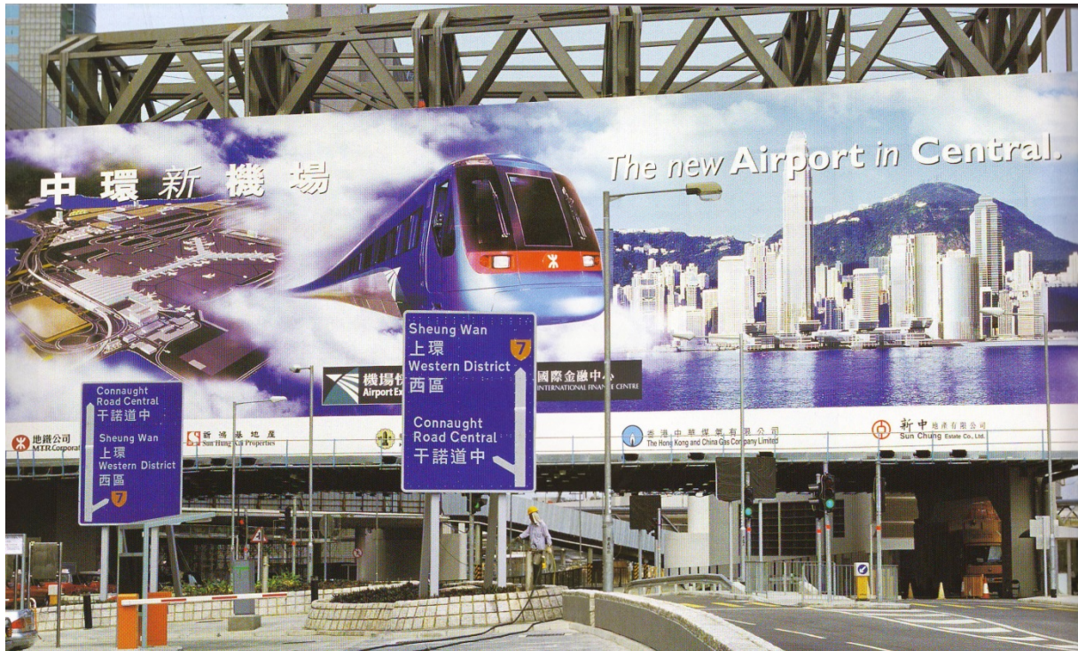
Figure 2 : « Fluid machine : 23 minutes de l'aéroport », 2000 Photographie Map Office (Laurent Gutierrez, Valérie Portefaix).