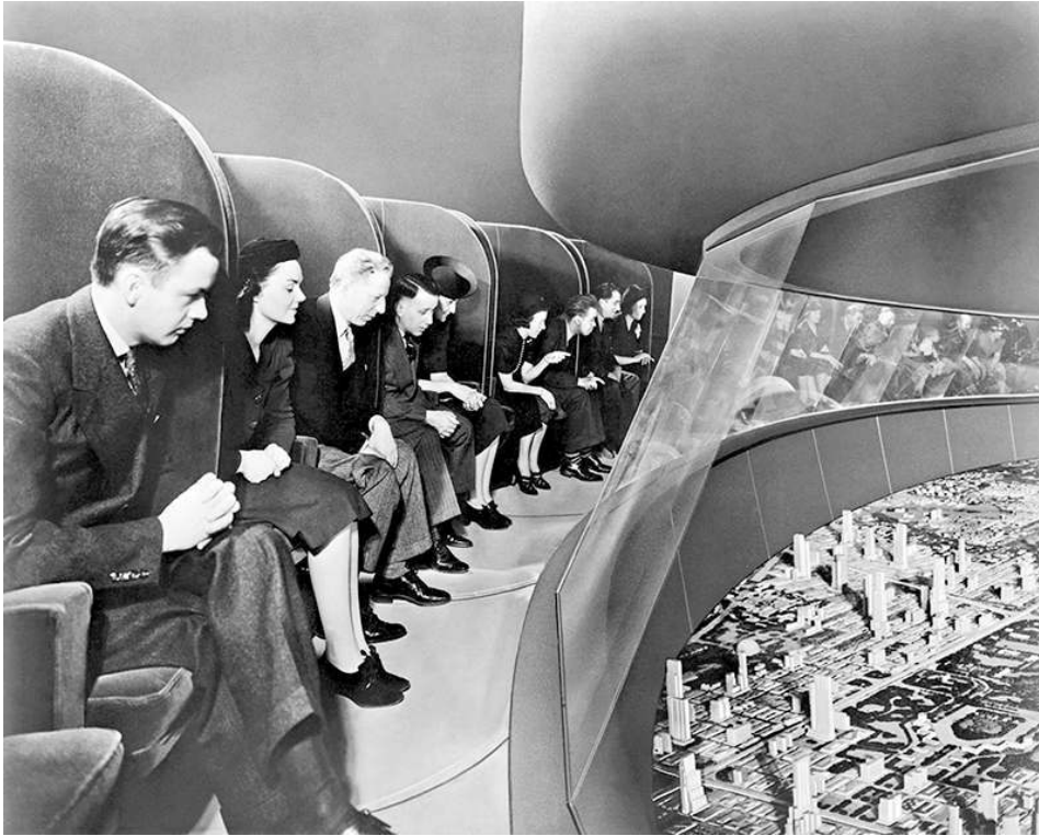
Figure 3 – Futurama, Pavillon de General Motors, visitors in moving chairs viewing exhibit, World's Fair, New York, 1939-40

réunissant 250 000 habitants, gravitent quelque 70 villes-satellites ; au-delà s'étendent fermes et pâturages. Conçu par Norman Bel Geddes et hébergé dans le Pavillon de General Motors, le Futurama , autre grande attraction de l'exposition, présente quant à lui une immense maquette de « la ville de 1960 », inspirée des projets corbuséens, cité de gratte-ciel profilés et espacés que 28 000 personnes survolent chaque jour, à bord d'un train automatique de fauteuils sonorisés qualifiés de « machines à explorer le temps ». La référence wellesienne vaut aussi pour l'expérience spatiale que propose l'attraction. Les fauteuils mobiles projettent littéralement les spectateurs au cœur de la maquette pour la vivre, comme l'annonce le narrateur : « Pour entrer dans cette scène du monde de demain [...] Ouvrez vos yeux sur le futur » (Kilhstedt, 1986) (figure 3).