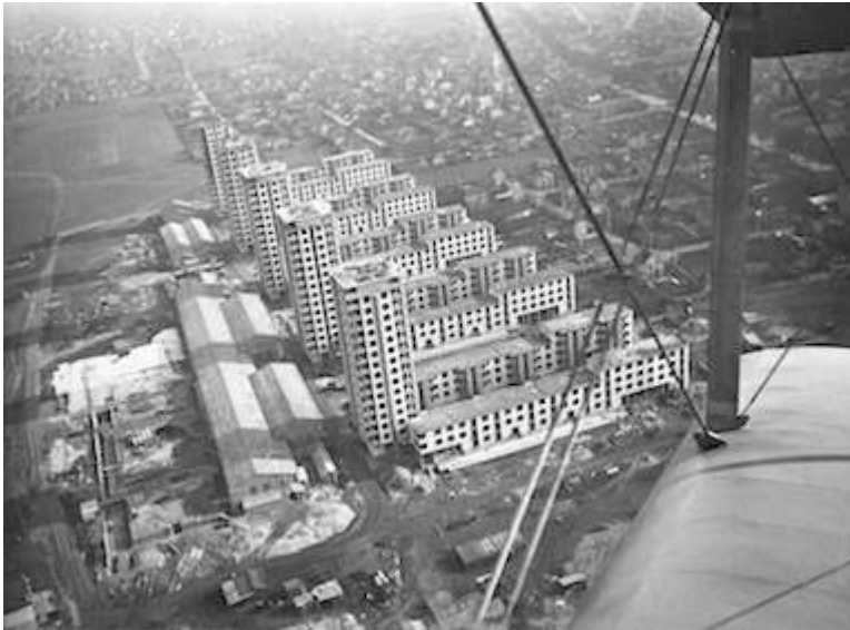
Figure 1 – Cité de la Muette, Drancy, vue aérienne du chantier, 1931-34