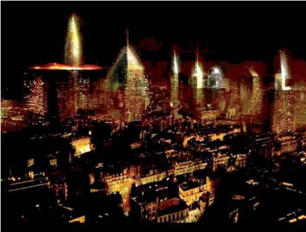
Figure 7 – Réflexion sur le développement urbain de Paris

Consultation internationale du Grand Paris, 2008-09.