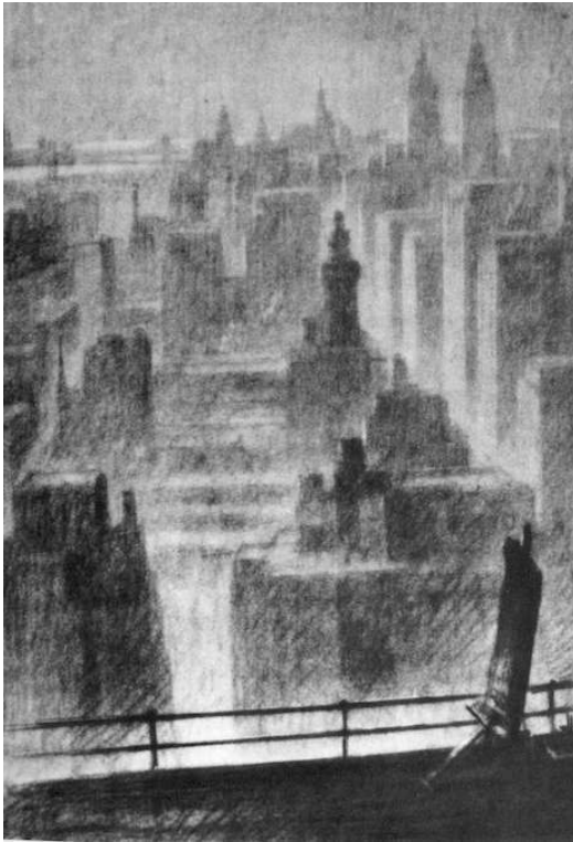
Figure 2 – Hugh Ferriss, La ville à l'aube, vue aérienne , circa 1923

Publiée in La Métropole du Futur , 1929, p. 20.