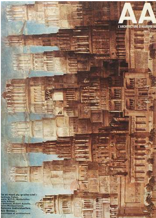
Figure 5 – « Vie et mort du gratte-ciel »

avec « l'urbanisme inhumain », le « gigantisme » et la « rénovation sauvage ». Le nouveau président mettra un terme provisoire à la construction des tours à Paris. « Vie et mort du Gratte-ciel » : l'éditorial du dossier publié par L'Architecture d'aujourd'hui , dirigée par Bernard Huet, est à charge. « Produit privilégié de l'espace dominant, le gratte-ciel a joué un rôle décisif dans la rupture du rapport entre typologie et morphologie urbaine qui provoquera la crise moderne. Crise à laquelle le gratte-ciel tentera de répondre par l'idéologie anti-urbaine de « la ville verticale », « ville dans la ville », microcosme social idéal, autonome et ordonné, dressé face au chaos urbain » (AA, n° 178, 1975, p. 1) (figure 5).