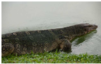
(a) Image d'un reptile dans l'eau, mise à disposition par Santner [16].