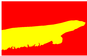
(b) Segmentation dans l'optique d'une application de retouche d'image : l'élément principal (le reptile) est extrait du fond.