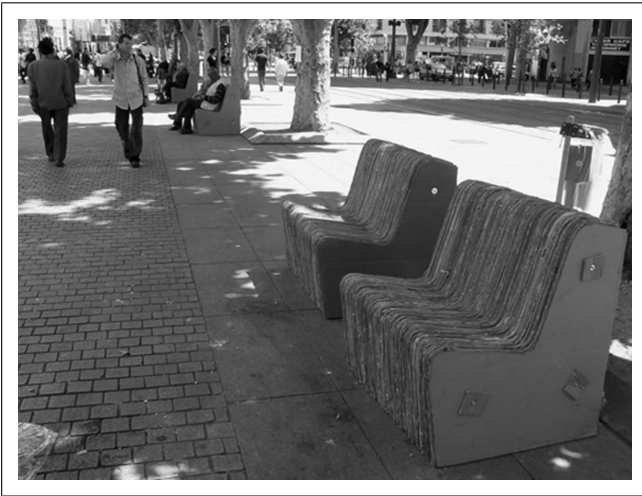
Fig. 3 Sur le Cours: installation temporaire de bancs par l'association El otro lugar/L'autre lieu