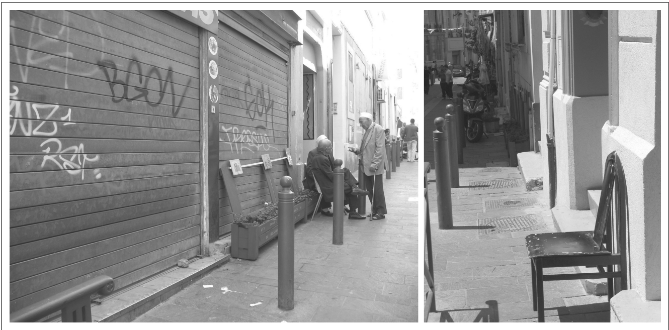
Fig. 2 Dans une rue débouchant sur le Cours Belsunce les résidents utilisent leurs propres chaises