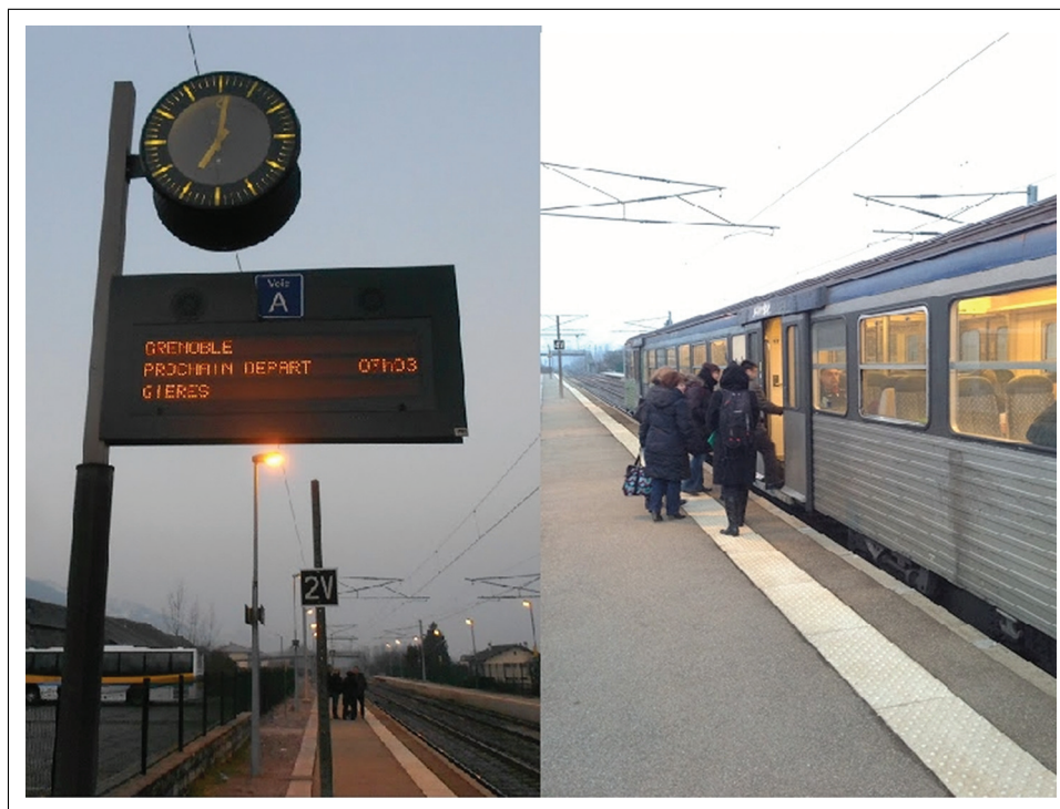
Photographie 1 : Gare de Lancey, 7 h 00 du matin, un groupe de collègues monte dans le train.