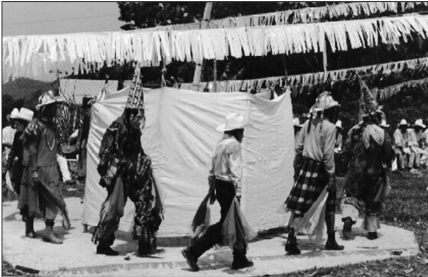
Photo 2 : Danse de Huehues-Sitkam à Leakaman, Huehuetla (Mai 2003).

La danse se déroule en trois phases, toutes marquées par différentes séries de mélodies jouées par le trio. Dans une première phase les danseurs font une ronde autour du mât, en effectuant des zapateados , c'est-à-dire en battant le rythme de leurs pieds chaussés de bottines (Photo 2). Au cours d'une seconde phase, pendant que les autres danseurs continuent leurs mouvements circulaires en alternant le sens de rotation, un comparse caché derrière l'enceinte en toile anime deux marionnettes en bois, l'une féminine, l'autre masculine. Celles-ci se saluent et applaudissent à la vue des danseurs qui tournoient autour d'elles en contrebas.