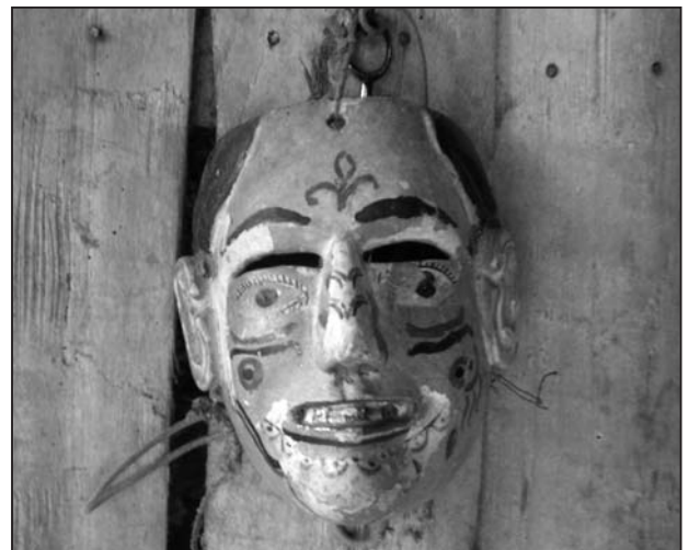
Photo 3 : Ancien masque de bouffon, Lipuntahuaca, Huehuetla.

bambou. On peut se demander, à l'instar de G. Stresser-Péan ( op.cit. : 256), dans quelle mesure ce retrait des feuilles couvrant le mât symbolise le retrait de la forêt ou plutôt le défrichage périodique effectué pour cultiver le maïs. Si cela n'est pas explicité par les informateurs, l'interprétation est plus que plausible, car dans certaines versions du mythe de la découverte du maïs,