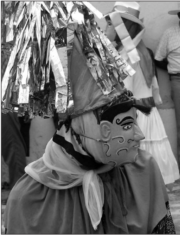
Photo 1 : Bouffon ( payaso , kgamana ) de la danse des Huehues-Slitkiwi de Jopala (Août 2005).

Pendant la danse huit ou dix hommes forment quatre ou cinq couples qui défilent autour de l'enceinte en alternant régulièrement le sens de rotation. Tous sont habillés à la manière des métis de la Sierra, une moitié en hommes, l'autre en femmes, et portent les masques respectifs, des visages de blancs aux cheveux noirs et moustachus pour les hommes et aux lèvres peintes en rouge pour les femmes. Les hommes travestis en femmes sont appelés xinulas (par déformation de l'espagnol señora ), le mot désignant en totonaque les femmes non-indiennes ou les femmes totonaques s'habillant à la mode métisse ou urbaine. Deux ou trois personnages supplémentaires forment cette danse : un garçon, qui porte un masque de chien et est censé suivre en permanence l'un des danseurs qui est « le chasseur » (et porte éventuellement un fusil de chasse) et, normalement un, ou parfois deux, bouffons ou payasos . Ce clown cérémoniel,