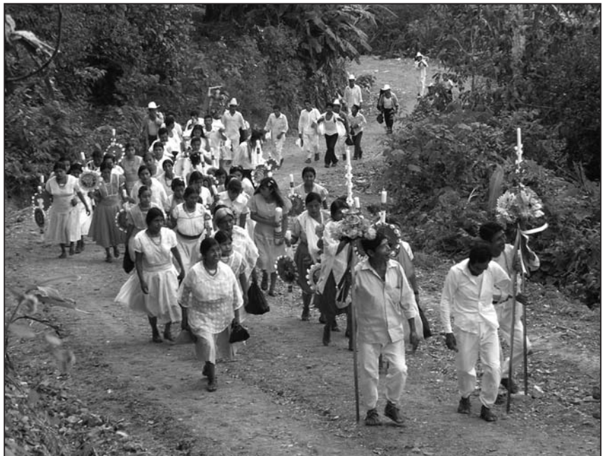
Photo 4 : Procession et offrande de cierges décorés lors de la fête patronale du village de Putlunichuchut, Huehuetla (Mai 2006).

À la fin du cycle du déroulement sur deux jours de la danse des Huebues pendant la fête patronale du chef-lieu de Huehuetla ou d'un des villages subordonnés, les danseurs terminent leur service communautaire en exécutant un dernier air ( son ) chez un ou plusieurs des mayordomos , cette poignée d'hommes qui, avec l'aide de leur famille et voisins, ont organisé et financé la fête patronale, notamment les processions, les repas communau-