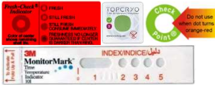
Figure 3 : Illustrations de divers indicateurs temps-température colorés