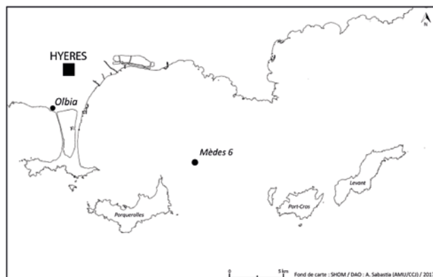
Figure 1. Localisation de l'épave en rade de Hyères (DAO : A. Sabastia (AMU/CCJ))

de mettre au jour une partie des vestiges conservés de la coque et de réaliser une série de prélèvements pour les analyses xylogologiques sur toutes les pièces d'architecture.