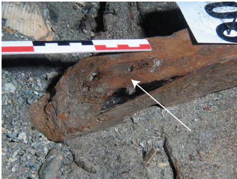
Figure 3. Canal sur creusé sur le dos de la membrure M106 (flèche). L'échelle est graduée en centimètres.

L'assemblage des membrures sur le bordé est réalisé au moyen de gournables (parfois traversées de clous) et de ligatures internes (Marlier, 2007) passant à mi-bois dans les membrures, verrouillées par des chevilles (Fig. 3). Les fibres végétales composant les ligatures sont tressées avec soin. Les gournables employées dans la construction sont en sapin blanc ( Abies alba ). Cette même essence est utilisée sur tous les navires à membrures ligaturées pour le façonnage des gournables servant au verrouillage des ligatures. Et cela, même si les gournables simples sont façonnées dans une autre essence, comme c'est le cas pour les épaves Baie de l'Amitié et Barthélémy B , (Rival, 1991 : 86 ; Wicha, 2005). Aucun schéma d'alternance entre ces différentes méthodes d'assemblage n'a été observé.