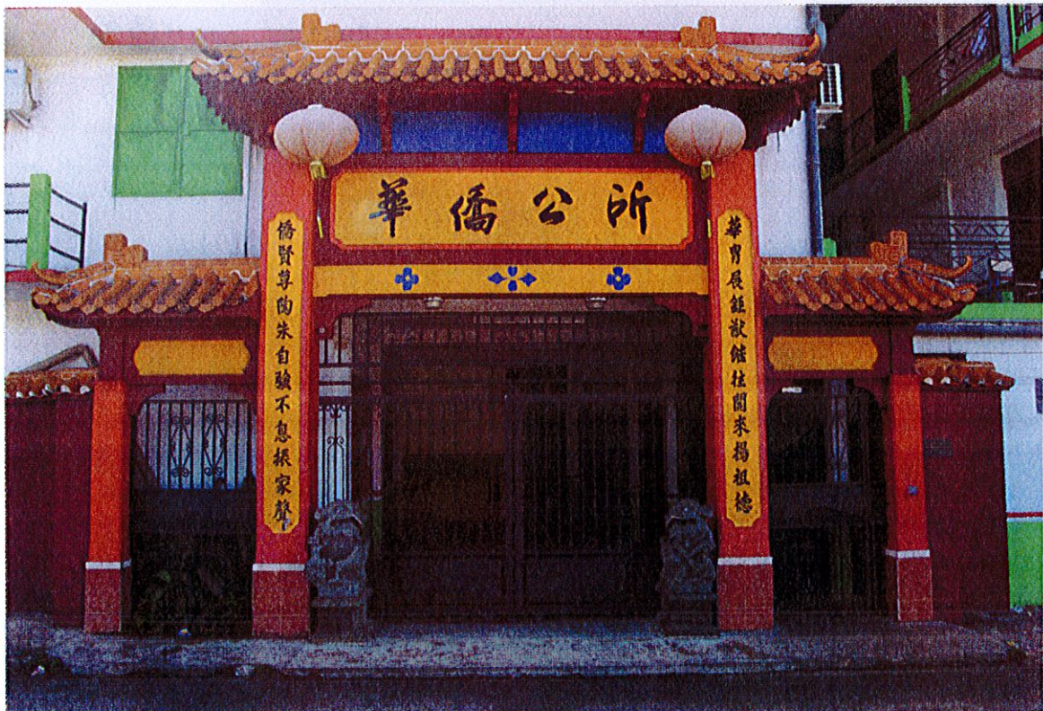
Siège de l'association Fa Kiao Kon So, Cayenne, Dubost, décembre 2012