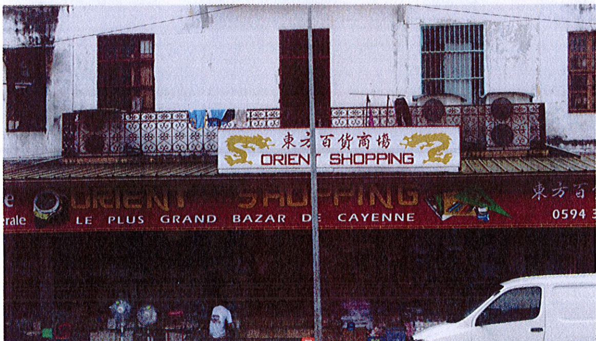
Bazar qingtian, Cayenne, place des Palmistes, Dubost, juin 2015