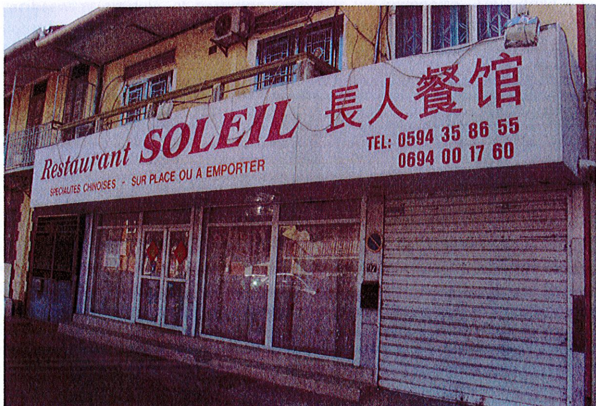
Restaurant chinois (Soleil), Cayenne, Dubost, juin 2015