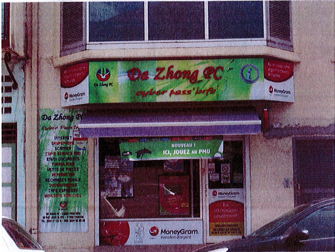
Siège de l'association AJE, Cayenne, Dubost, juin 2015