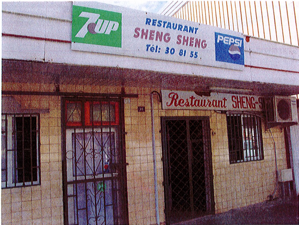
Restaurant Chinois (Sheng Sheng), Dubost, juin 2015