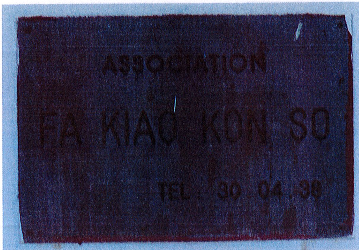
Nom de l'association Fa Kiao Kon So apposé sur le mur, Cayenne, Place des Amandiers, Dubost, décembre 2012