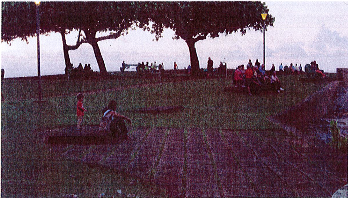
Rencontres un soir de juin, Cayenne, Pointe des Amandiers, Dubost, juin 2015