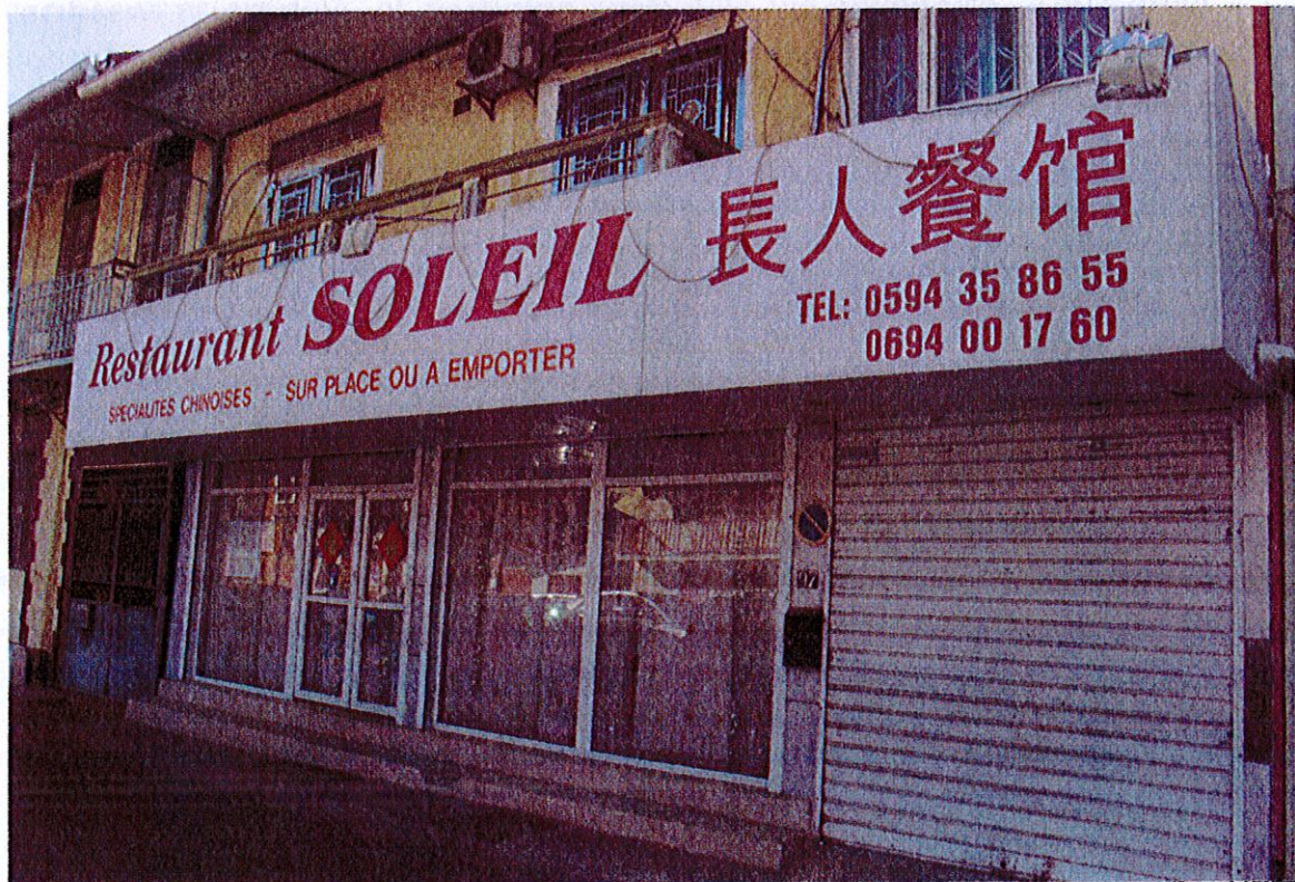
Restaurant chinois (Soleil), Cayenne, Dubost, juin 2015