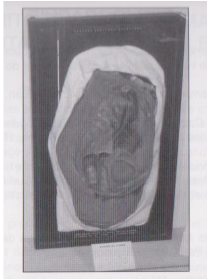
Système génital féminin en papier mâché (début XX e siècle) Salle d'anatomie et d'embryologie du Muséum d'histoire naturelle de Rouen