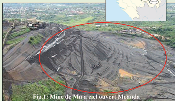
Fig.1: Mine de Mn à ciel ouvert Moanda

L'objectif de cette étude est de comprendre l'impact des fortes [Mn] dans le sol sur l'absorption d'éléments nutritifs et minéraux essentiels pour la croissance des plantes.