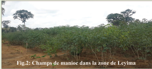
Fig.2: Champs de manioc dans la zone de Leyima