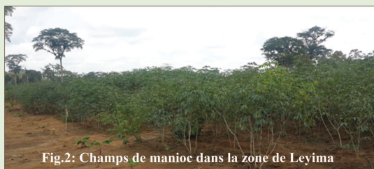
Fig.2: Champs de manioc dans la zone de Leyima