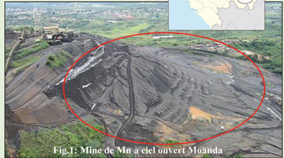
Fig.1: Mine de Mn à ciel ouvert Moanda

L'objectif de cette étude est de comprendre l'impact des fortes [Mn] dans le sol sur l'absorption d'éléments nutritifs et minéraux essentiels pour la croissance des plantes.