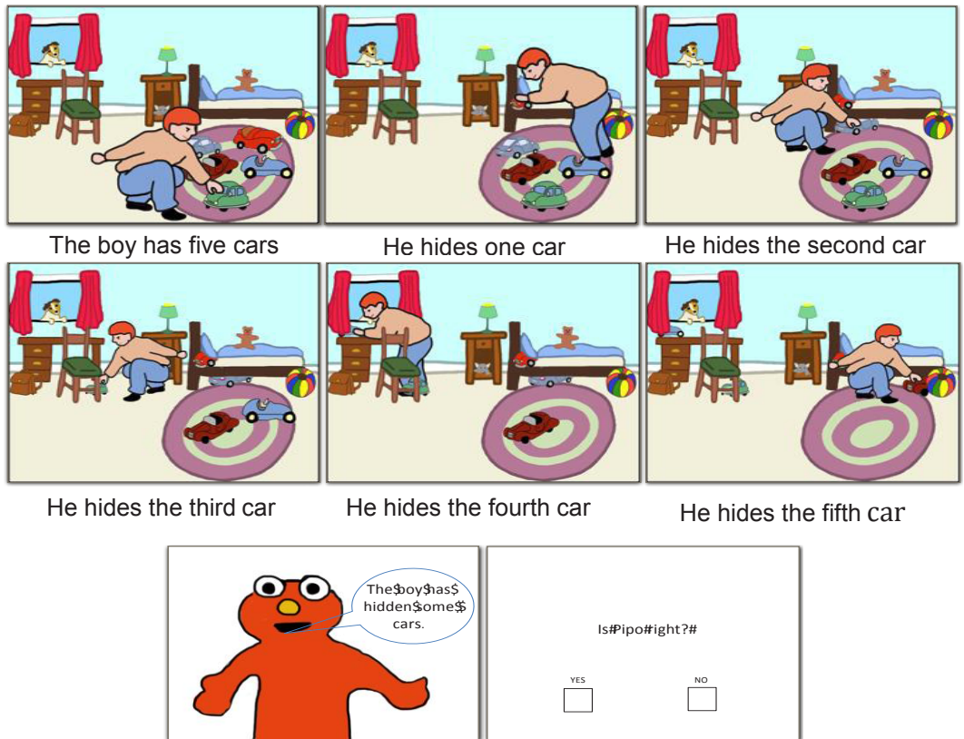
Fig.2. Un exemple de scénario pour la condition-test.

Nous voulions tester les populations d'apprenants et les monolingues contrôles en utilisant le même protocole expérimental et surtout nous voulions, contrairement à Slabakova (2010), tester les apprenants dans leurs deux langues. Pour cela, nous avons présenté la totalité du matériel expérimental (vingt items) aux monolingues dans leur L1 et divisé le matériel expérimental en deux pour que les apprenants puissent voir la moitié des items dans leur L1 et l'autre moitié dans leur L2 en prenant soin de randomiser les items dans chaque bloc linguistique, ainsi que l'ordre des langues.