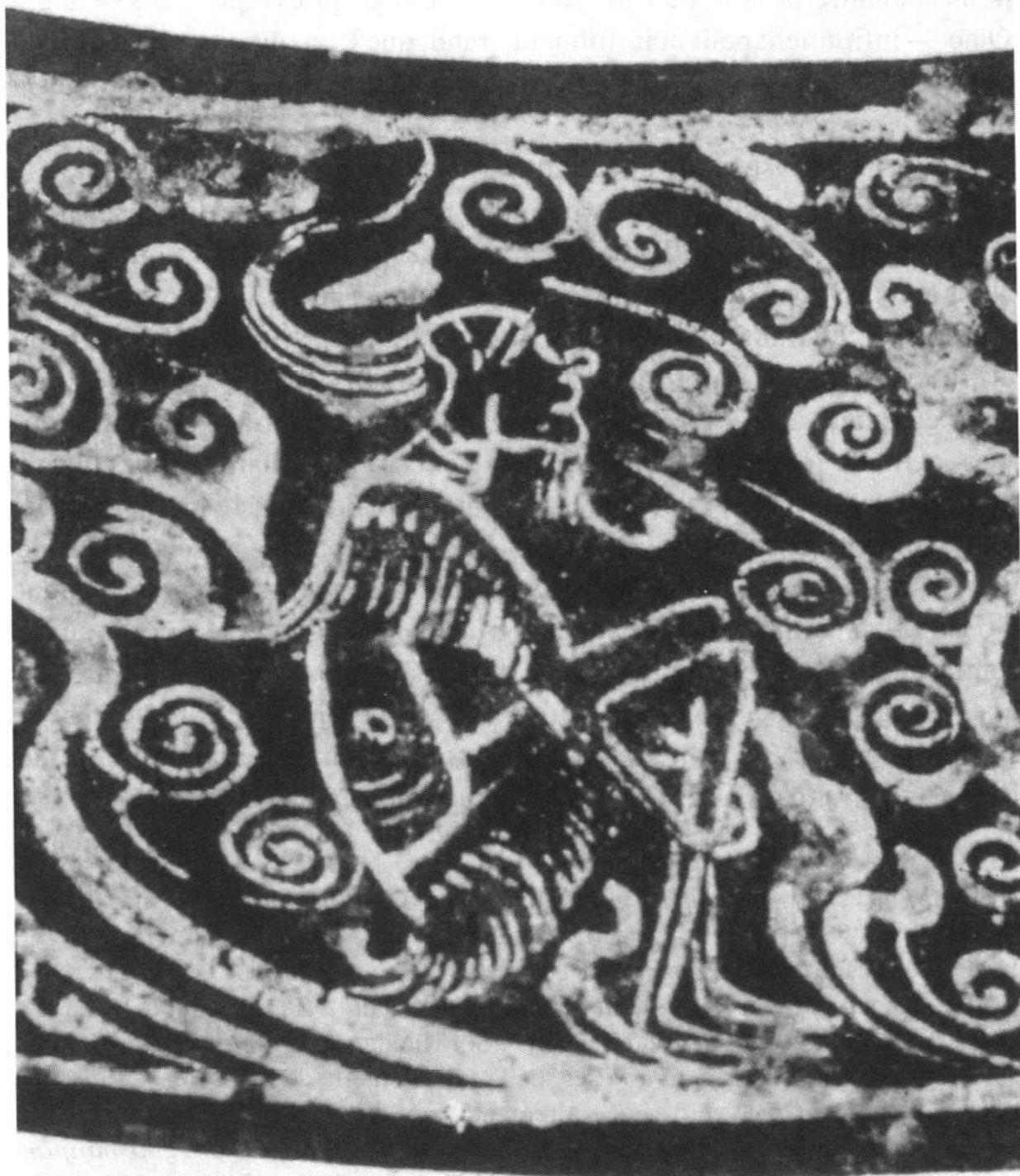
Fig. 2 : Immortel cheveux au vent. Détail de la frise d'un miroir Han. D'après Michael Ivanovitch Rostovtzeff, Inlaid Bronzes of the Han Dynasty in the Collection of C.T. Loo , Paris/Bruxelles, 1927, pl. XII.