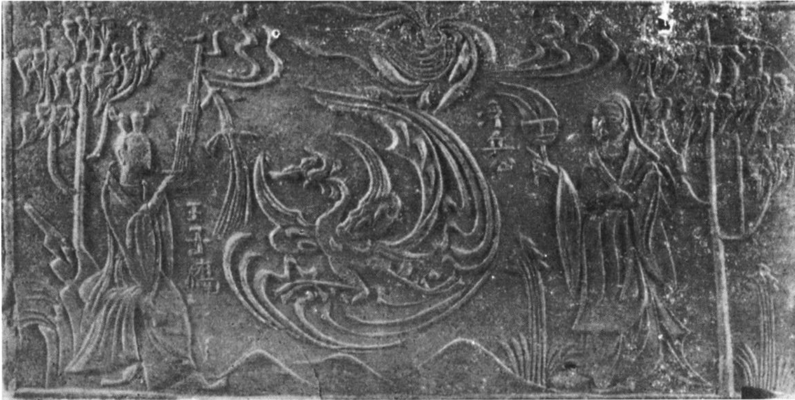
Fig. 6 : Wangzi Qiao et Fuqiu gong. Brique funéraire de Dengxian. « Dengxian caise huaxiang zhuan mu », Pékin, Wenwu chubanshe, 1958, p. 25.