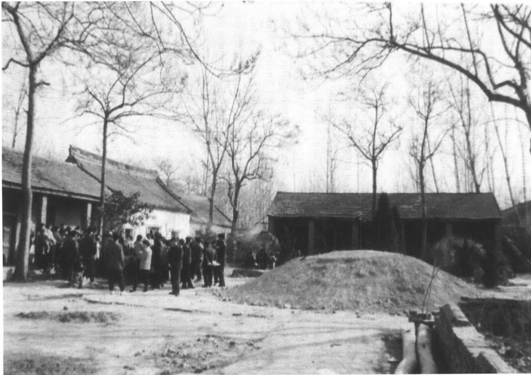
Fig. 7 : La nouvelle tombe de Wang Qiao devant son temple. Yexian, Henan, 1995.