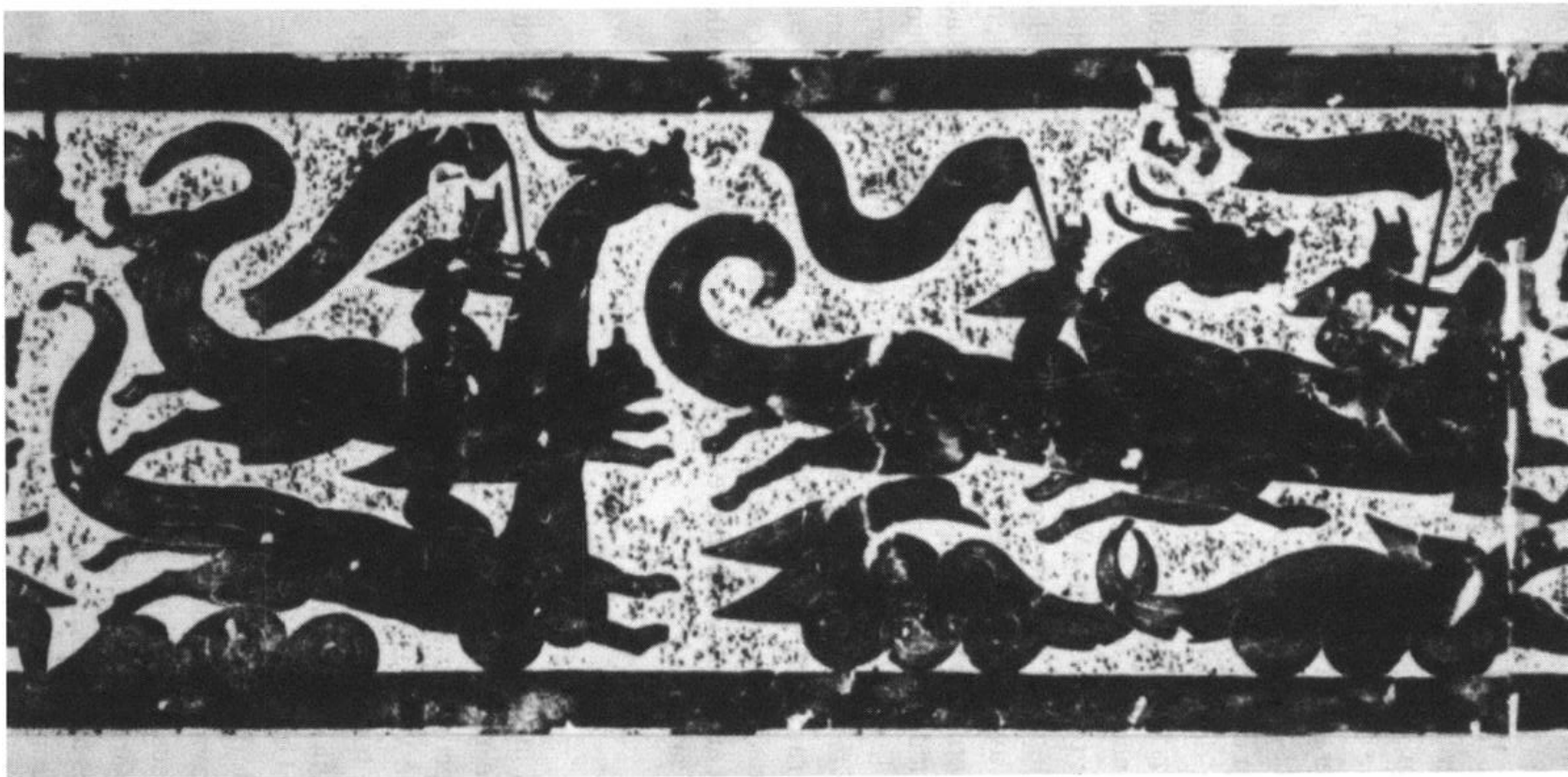
Fig. 3 : Immortels avec bannière. Pierre gravée de la chambre d'offrandes dédiée à Wu Liang, Shandong. D'après l'estampage conservé à la bibliothèque Fu Ssu-nien, Institut d'Histoire et de Philologie, Academia Sinica, Taipei.