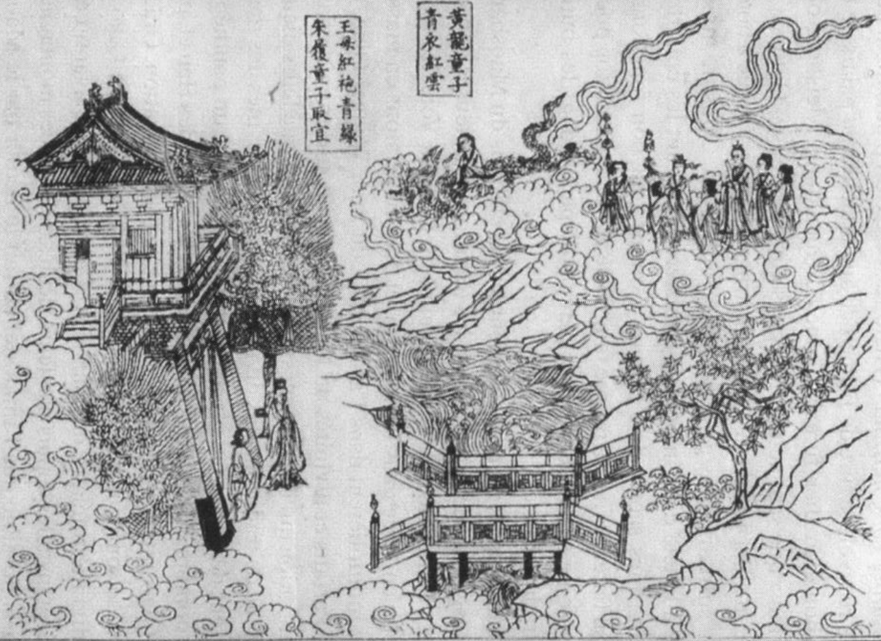
Fig. 5 : Wangzi Qiao arrivant sur le mont Tongbo pour y prendre ses fonctions, Daozang , vol. 334, p. XIV/0631 ; photo gracieusement fournie par la bibliothèque Fu Ssu-nien, Institut d'Histoire et de Philologie, Academia Sinica, Taipei.

第九天台山一名桐栢樓山有洞府號曰 金庭宮精暉伏晨光照洞域瓊臺玉室瑩朗 軒庭泉則石髓金精樹則蘇牙琳碧信謂養 真之福境成神之靈墟也王君處焉以理幽 顯侍弼帝晨有時朝奉領司諸嶽群神於茲