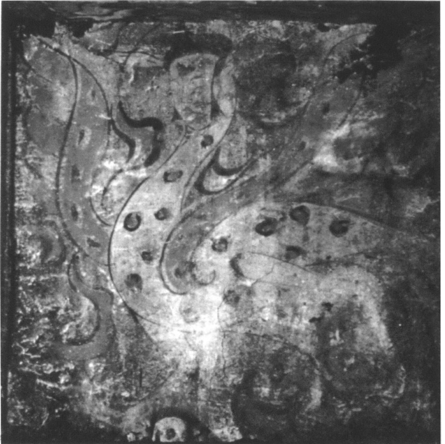
Fig. 4 : Peinture d'un homme à corps d'oiseau identifié à Wangzi Qiao dans la tombe de Bu Qianqiu, Henan. D'après Huang Minglan, Guo Yinqiang, Luoyang Hanmu bihua , Pékin, Wenwu chubanshe, 1996, p. 76, pl. XIX.