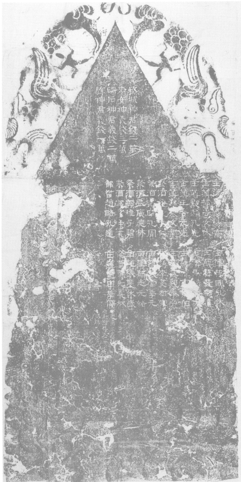
Face recto de la stèle du Seigneur de la Pierre Blanche (Nagata Hidemasa, Kandai sekkoku shūsei , 2 vol., Kyōto, Dōhōsha, 1994, p. 239)