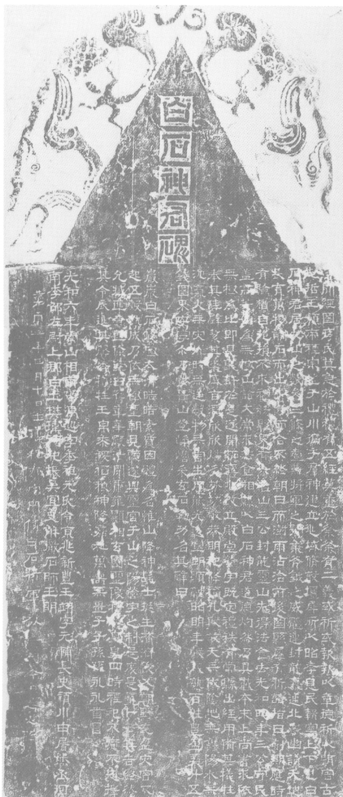
Face verso de la stèle du Seigneur de la Pierre Blanche (Nagata Hidemasa, Kandai sekkoku shūsei , 2 vol., Kyōto, Dōhōsha, 1994, p. 241)