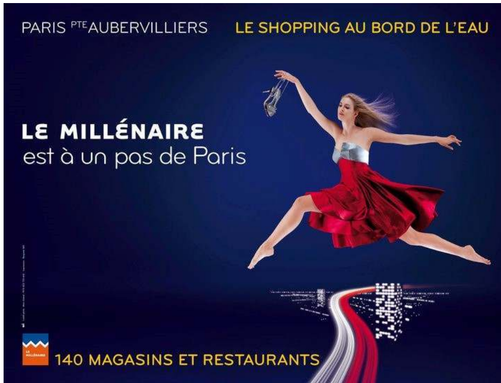
ILL. 2 – Affiche pour le lancement du centre commercial Le Millénaire 16