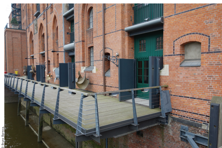
Exemple de mesures de prévention : protection « anti-crues » ouvertes - Musée maritime de Hambourg.

Actuellement, les professionnels de la conception urbaine – confrontés à des risques toujours plus difficiles à appréhender dans leur globalité – semblent balancer entre deux stratégies : approfondir l'expertise, l'étude et le travail autour des risques à travers des qualifications, des parcours de formation suffisamment précis pour être capables d'appréhender la ville dans sa spécificité au regard du risque ; ou au contraire, considérer que la qualité des projets urbains naît, avant tout, de la confrontation des points de vue de différents professionnels dans une démarche de co-production et abandonner la gestion des risques à des expertises techniques 4 . Ces deux options renvoient à des approches différentes du risque urbain : pour l'une, le risque est un des éléments-support de la conception à la source du projet ; pour l'autre, il constitue un problème hybride, qui sera pris en compte avec les retours des experts et des bureaux d'études techniques.