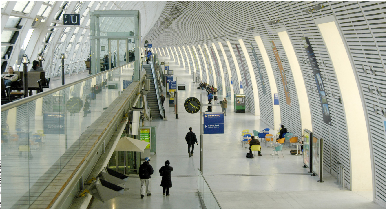
Hall de la gare d'Avignon-TGV

tème, en particulier à la récursivité qui affecte le fonctionnement de ses composants et organisation qui « en fonctionnant se transforment. » La systémique permet d'entrer dans l'intelligence d'un phénomène et d'en orienter son action. La prise en compte d'impératifs non-techniques qui vont interagir ne permet pas de réduire la résilience urbaine ni même le génie urbain à des systèmes techniques et ouvre à des impératifs environnementaux, humains, sociaux. La complexité suscite des phénomènes d'émergence, notamment dans les périodes de crise et de post-crise, certes intelligibles mais non toujours prévisibles. Les comportements observés des systèmes vivants et des systèmes sociaux fournissent d'innombrables exemples de cette complexité, une complexité à la fois organisée et, récursivement, organisante.