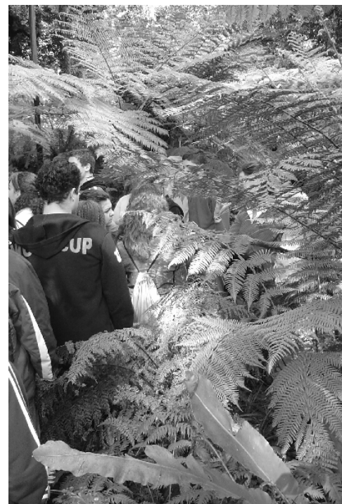
Figure 5 : Les visiteurs dans la zone des fougères

Cependant, quasiment tout le reste du jardin est divisé en fonction d'une classification qui est liée à la recherche de l'exotisme et de l'altérité. Ce phénomène est particulièrement net dans trois des divisions du jardin. La première est la zone aride (« M ») avec ces cactus immenses, de toutes les espèces et toutes les formes. Le panneau explicatif de l'installation présente un paysage de canyons où se dressent quelques cactus sous un soleil de plomb : c'est clairement à ce paysage de western que veut renvoyer l'espace qui nous est présenté. Le public interrogé sur la question fait ainsi référence le plus souvent au désert ou même au Mexique. La palmeraie (zone « E ») est un peu à l'écart et n'est donc généralement pas directement visitée mais du fait de la hauteur de la végétation, elle constitue le plus souvent l'arrière-plan des autres espaces. Le palmier est clairement l'icône de l'exotisme, que ce soit celle du Maghreb ou mieux encore celle de l'insularité tropicale. Le dernier exemple assez clair est la zone « F » qui présente les fougères. Cet espace est en contrebas par rapport au reste du jardin, dans une sorte d'amphithéâtre dont le degré d'humidité est constamment maintenu par des canaux et un arrosage abondant. Des arbres ferment la voûte, ce qui contribue à isoler l'installation.