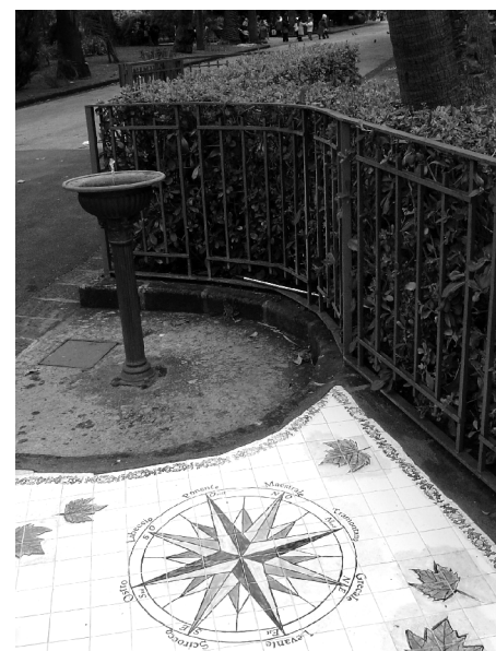
Figure 3 : La rose des vents à l'entrée de l'Orto Botanico

rencontre sur le parcours. Là encore, c'est le registre de la découverte et du voyage lointain qui est suscité.