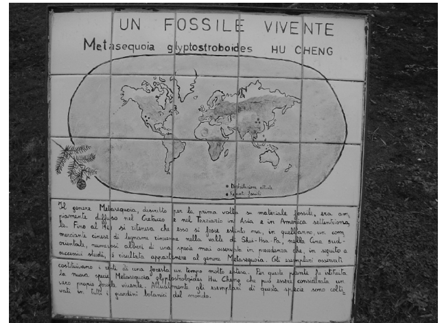
Figure 4 : Un panneau explicatif sur le Metasequoia glyptostroboides

du côté de la « nature-cosmos » : c'est un espace dense dont les objets renvoient au monde entier.