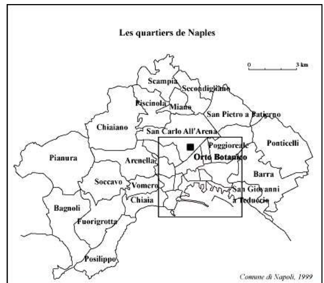
Figure 1 : Localisation du Real Orto Botanico à Naples

Naples possède peu de jardins publics. Dans le contexte d'une ville particulièrement dense et minérale, la « nature » dans la ville se trouve ainsi condensée dans des espaces très retréints ou privés. Ainsi, contrairement aux formes de jardin de la suburbia qui s'étendent à perte de vue mais qui se réduisent à la seule manifestation physique de la verdure, les cinq grands jardins de Naples ont une forte densité symbolique. On se propose ici de déconstruire le plus complexe d'entre eux, du fait de sa fonction et de son système de classification : le Real Orto Botanico (jardin botanique) de Naples.