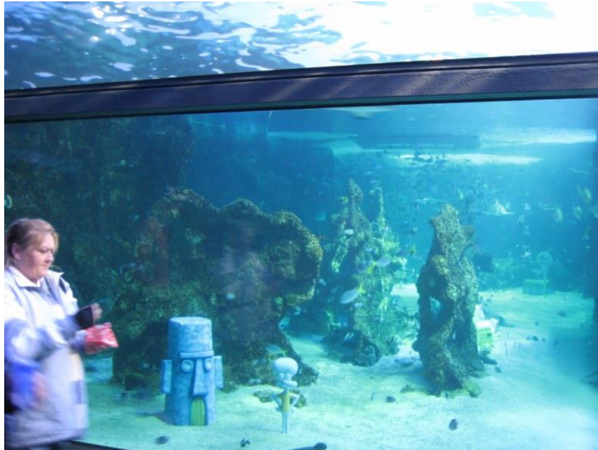
Figure 3 : Éléments de décors dans le bassin présentant la grande barrière de corail, aquarium de Sydney, 2008

Les bassins sont rapidement ornés de pierres, de constructions miniatures voire de véritables décors, avec des épaves ou des sculptures renforçant le caractère exotique ou sauvage d'un lieu et de ses habitants. Cette pratique est tout à fait active dans les installations contemporaines.