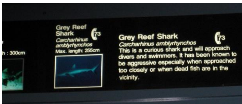
Figure 1 : Un panneau de présentation du Requin gris des Récifs, Aquarium de Sydney, 2008

Le bassin des requins de Sydney forme un ensemble clairement délimité du reste de l'aquarium. On y accède par un escalier qui donne sur un parcours circulant d'abord dans le centre du bassin, à travers un tunnel en plexiglass puis en surface. Les requins sont donc rattachés à un ensemble commun par leur appartenance à un même lieu, qui les distingue de tous les autres animaux, et par le système de taxinomie binomale ( Carcharhinus amblyrhynchos ) qui renvoie ici à un genre spécifique. Comme pour les zoos, la taxinomie est toujours une des méthodes de la mise en ordre du vivant dans les aquariums. Elle reflète à la fois l'héritage de son ancrage scientifique et l'utilisation d'animaux charismatiques qui attirent le public par leur taille, leur dangerosité supposée, leurs formes ou leurs couleurs sortant de l'ordinaire et justifient ainsi que l'institution leur consacre une section spécifique. Les requins, les loutres ou les pingouins sont ainsi quasiment systématiquement présents et individualisés dans les plans des aquariums.