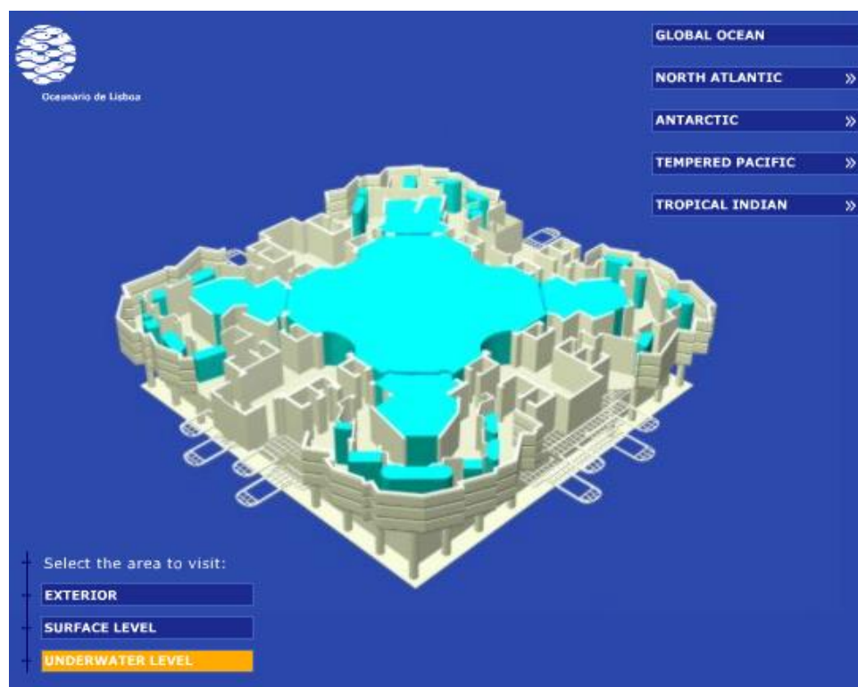
Figure 2 : Un extrait du plan de l'aquarium de Lisbonne, http://www.oceanario.pt/cms/37/ , le 24 juin 2014

1998, s'appuie sur l'idée d'un océan unique, subdivisé en vastes zones qui correspondent à des milieux.