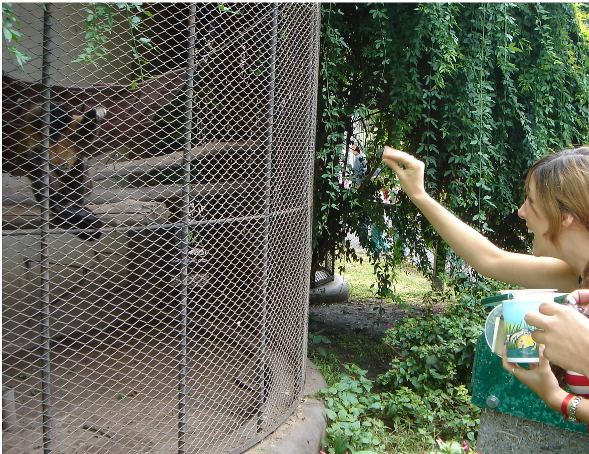
Figure 3 : Une jeune femme lançant du maïs soufflé à un singe. Buenos Aires, 9 mars 2007

Second élément, le zoo est un dispositif spatial dont le cœur est la proximité contrôlée plus que la limite absolue. Tout l'intérêt du zoo vient de sa fonction de médiation, c'est-à-dire de la possibilité de jouer avec les limites qu'il offre (Estebanez, Staszak, à paraître 2010). Le public est matériellement séparé des animaux et se sent pour cette raison en sécurité. Le risque d'agression étant maîtrisé, pense-il, on peut essayer de donner à manger aux singes, de passer la première rambarde pour prendre une meilleure photo, voire de plaquer sa main sur la grille : c'est précisément parce que la limite est claire que sa transgression paraît bénigne matériellement (le singe ne peut rien me faire) et symboliquement (il ne devient pas plus un humain que je ne deviens un singe). Les limites internes et ce qu'elles traduisent évoluent avec les technologies disponibles et la façon de penser ce qu'elles séparent. Des bêtes féroces – qu'on entourait de barreaux surdimensionnés afin de produire le spectacle de l'enfermement et de la domination d'animaux puissants – aux grands singes, dont on met aujourd'hui en scène la proximité avec les humains à travers l'utilisation de minces parois de plexiglas, il y a une constante négociation sur la juste distance entre eux (les animaux, les autres humains) et nous (photo 2).