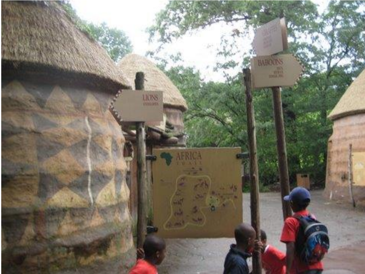
Figure 2 : Le village Somba du zoo du Bronx, 11 août 2008

qui valorise l'ailleurs ne s'arrête pas à la faune. Les décors et les mises en scènes des enclos sont souvent composés d'un ensemble de références à certaines cultures et certaines populations. L'importance symbolique et les valeurs que connote « l'Afrique » s'affichent également à travers la reconstitution d'un village « Somba » (photo 1).