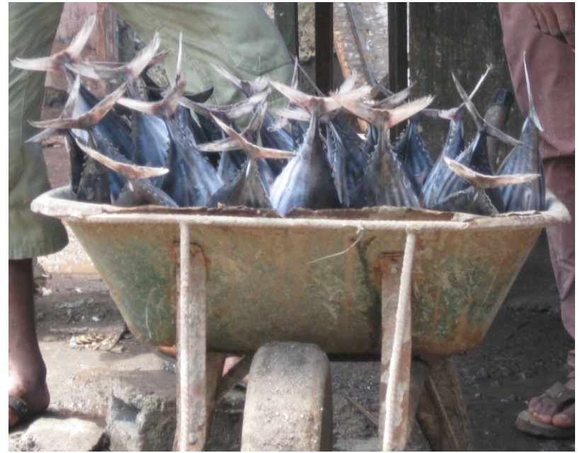
marché local de Mutsamudu