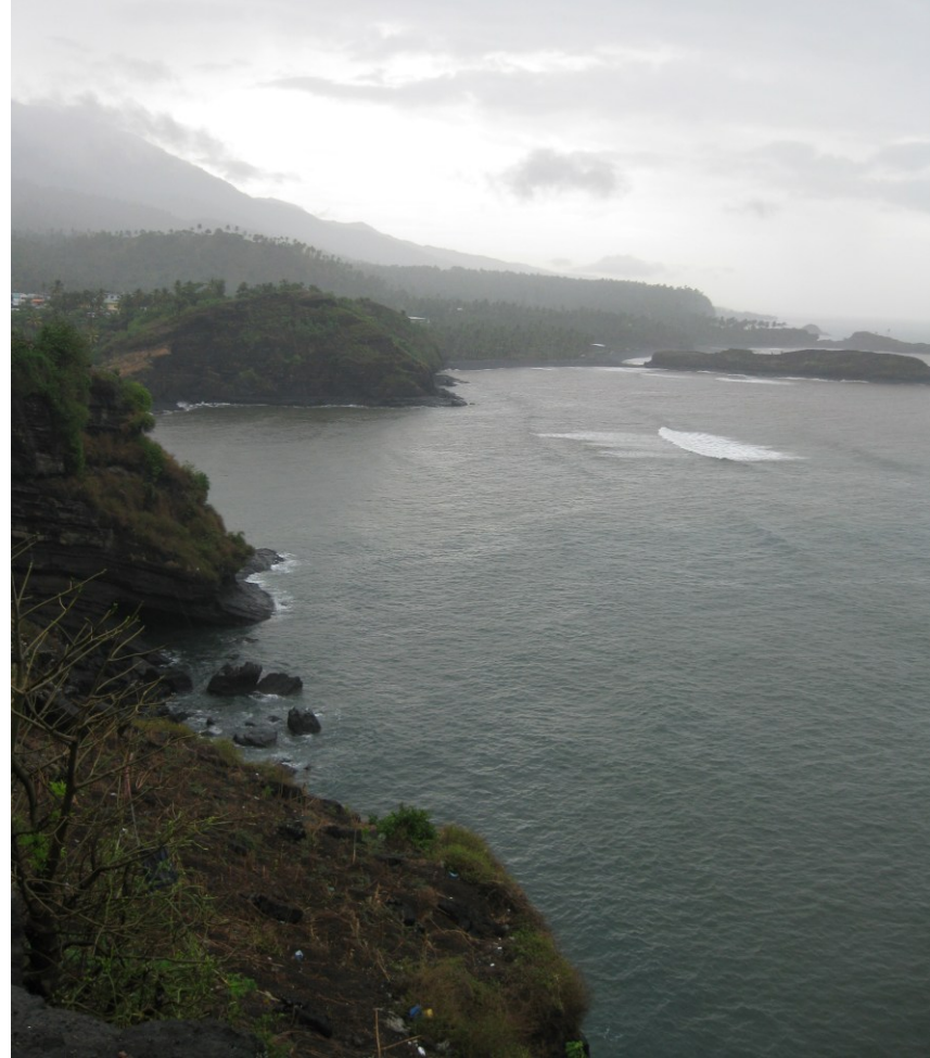
falaises de Domoni