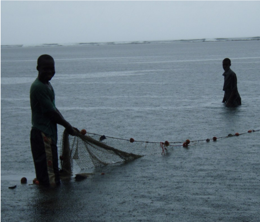
Femme et enfants à Bambao M'Tsangua

↳ pêche à pied : piégeage (poulpes, poissons, coquillages, ...)