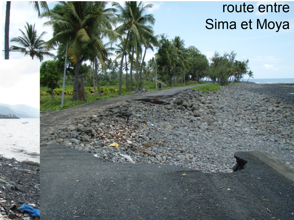
pollution de la plage de Mutsamudu par les déchets « urbains »