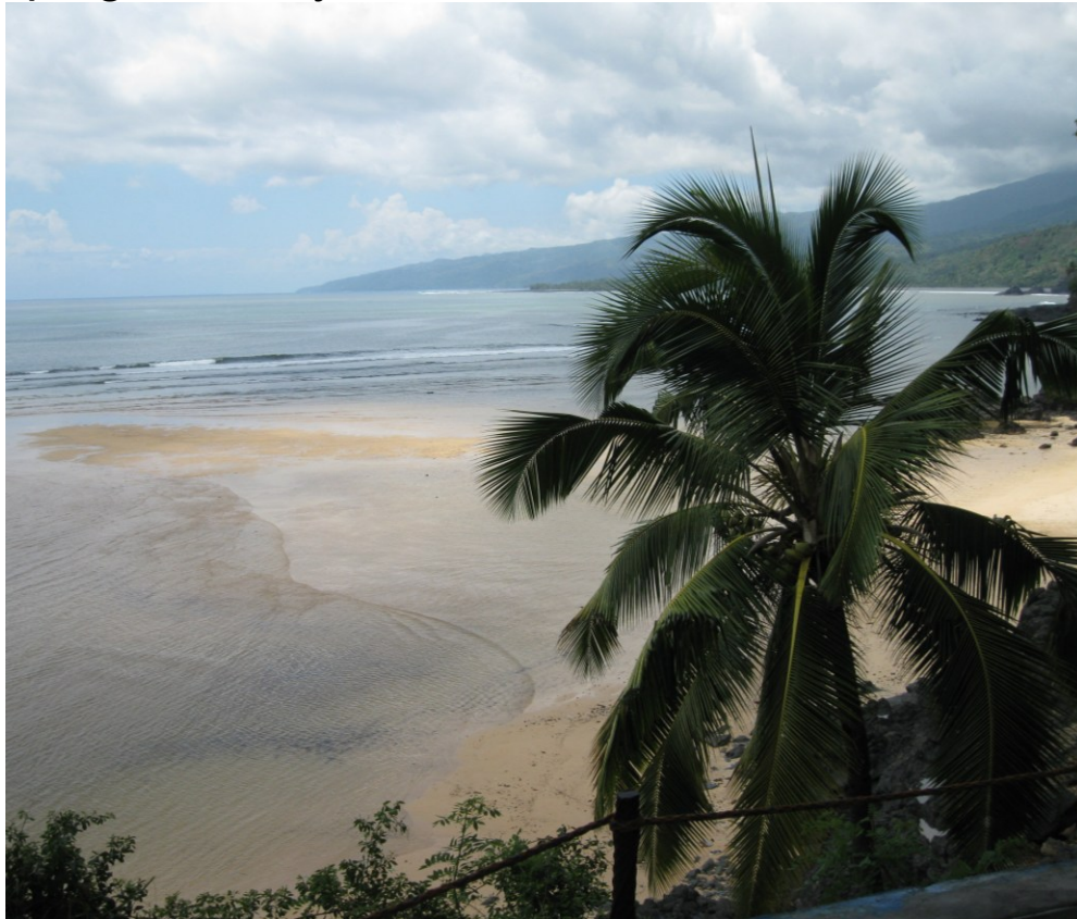
plage de Moya