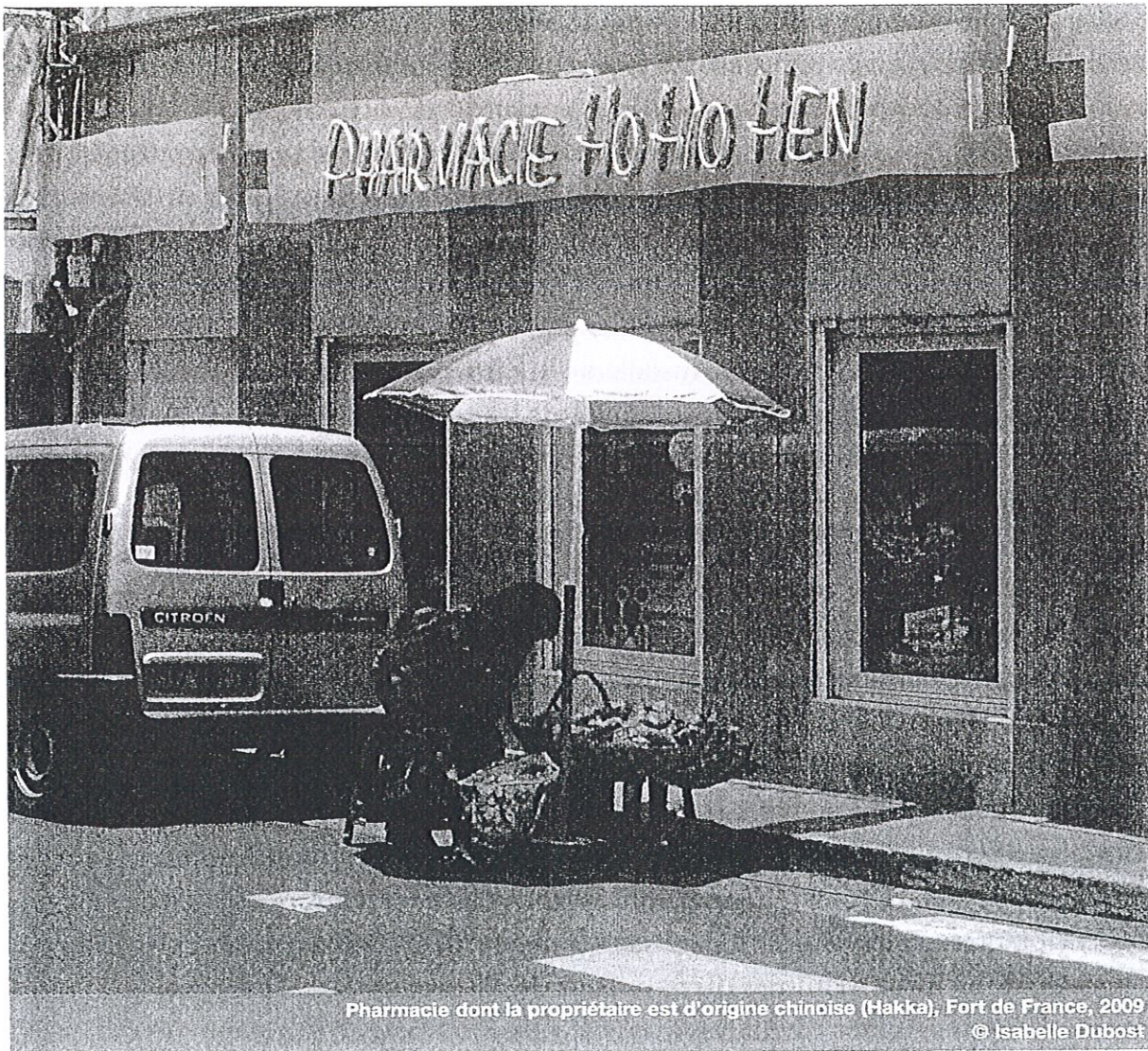
Pharmacie dont la propriétaire est d'origine chinoise (Hakka), Fort de France, 2009

gestion administrative de cette immigration a été placée sous l'entière responsabilité de l'État et des institutions publiques, locales ou nationales. Par exemple, outre les décrets présidentiels du 13 février et du 27 mars 1852 déjà cités, deux arrêtés sont pris dans les années qui suivent par le Conseil privé de la Guadeloupe, qui constituent un véritable code de l'immigration : en cinquante articles sont réglés tous les problèmes intérieurs inhérents à l'introduction de la main-d'œuvre étrangère. En 1854, le gouverneur de la même île crée un comité de l'immigration chargé de régler tous les problèmes liés à ce vaste transfert de main-d'œuvre. C'est l'administration de la colonie qui gère le recrutement des "engagés" : les planteurs lui adressent leurs demandes en main-d'œuvre et elle leur attribue les travailleurs recrutés. Un peu plus tard, c'est le Conseil général qui sera compétent pour tout ce qui concerne la gestion locale de l'immigration. C'est donc lui qui, chaque année, fixera le nombre d'immigrants nécessaires pour la campagne suivante et votera le budget de l'immigration.