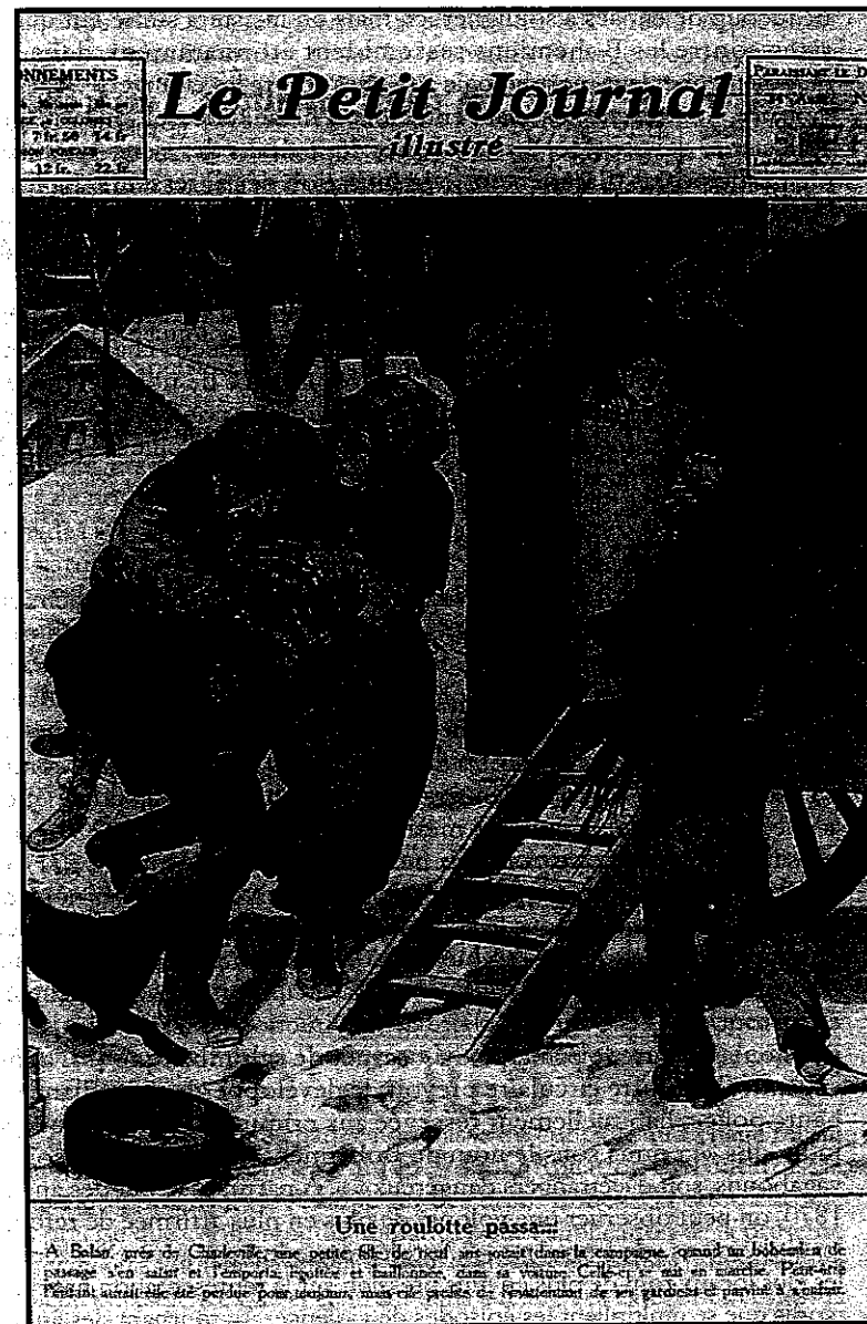
Une roulotte passa... A Balon, près de Chartres, une petite fille de huit ans s'est dans la campagne quand un bohémien de passage s'en sauta et l'emporta précipité et ballonnée dans sa voiture. Elle est en marche. Pour être précisée, elle fut perdue pour toujours, mais elle parvint à s'échapper de ses gardiens et parvint à s'enfuir.