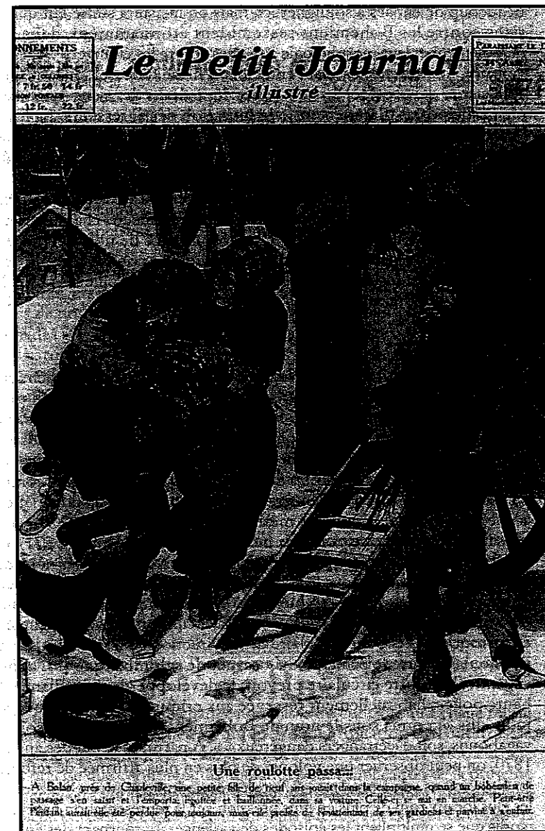
« Une roulotte passa... », Le Petit Journal , supplément illustré, 1923