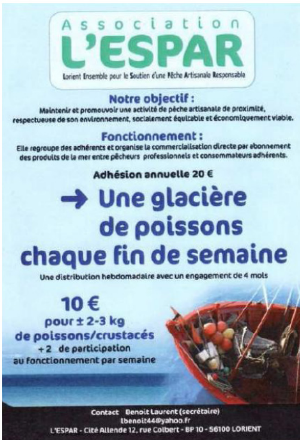
Figure 3. Les AMAP « Poisson » dans le grand Ouest français : exemples lorientais (à gauche) et nantais (à droite).