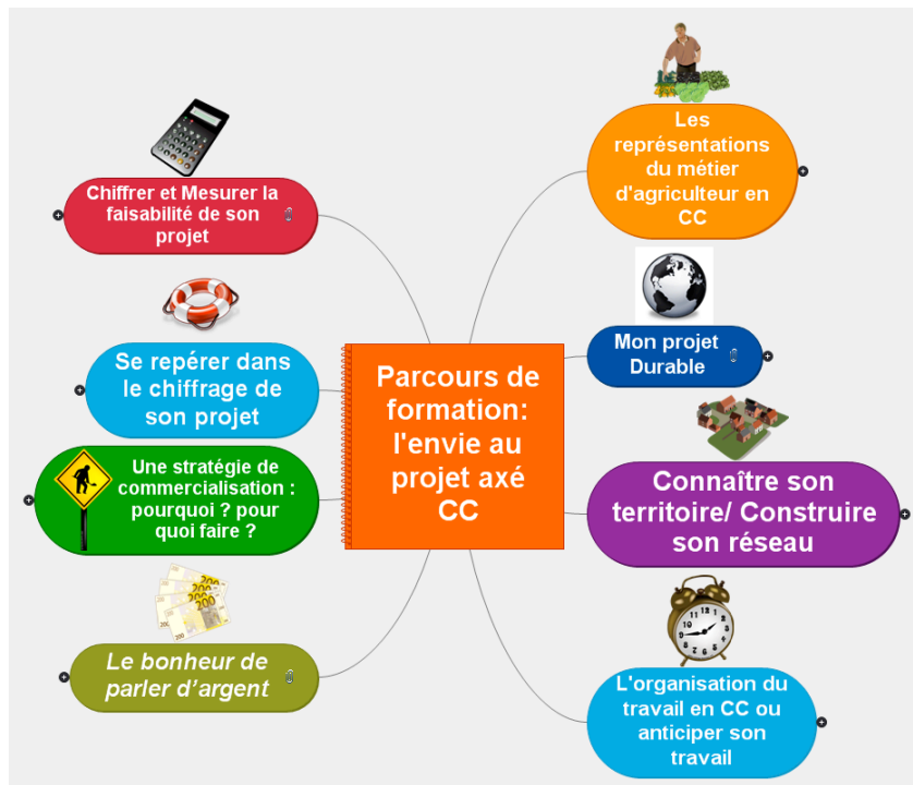
Figure 1 : Schématisation du parcours de formation "de l'idée au projet" avec des modules de formation permettant de construire un projet de commercialisation en Circuits courts.

les souhaits des agriculteurs sur l'exploitation, rapprocher le constat des objectifs qu'ils s'étaient fixés au départ, etc. A partir de cette analyse, les agriculteurs peuvent ensuite construire une stratégie pour faire évoluer leur circuit de commercialisation et poursuivre éventuellement leur réflexion au sein de formations thématiques ciblées.