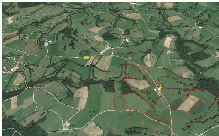
Figure 1 : Parcelle type « groupé », un site, un bloc de parcelles autour du site (90 % de la SAU)

l'opposé, celles ayant les parcelles les plus éclatés et dispersés ont une consommation de carburant majorée d'environ 13 %.