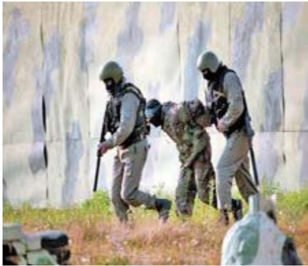
Arrestation d'un terroriste au Kazakhstan Zakon.kz, 26.12.2016

terroristes, y compris l'appel à des manifestations non autorisées 29 .