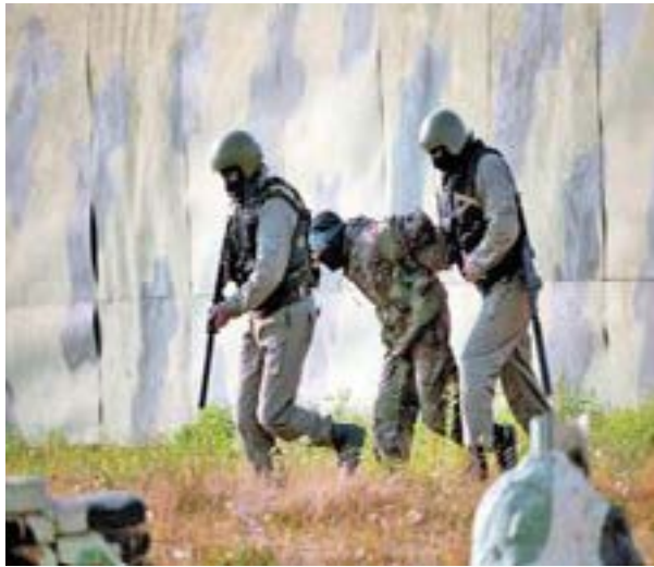
Arrestation d'un terroriste au Kazakhstan Zakon.kz, 26.12.2016

terroristes, y compris l'appel à des manifestations non autorisées 29 .