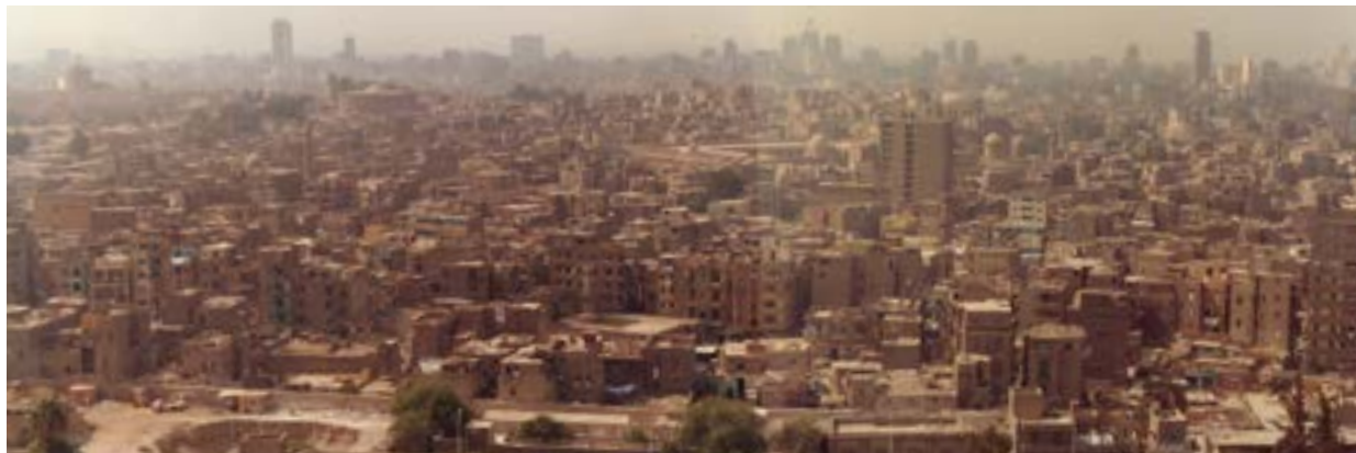
Imbaba, Le Caire

directe ou sans filtres de doctrines élaborées ailleurs (en revanche, il peut exprimer la volonté d'adhérer à une « manière de vivre saoudienne », associée à une promesse de prospérité) et qui d'autre part, s'inscrit – dans ce contexte précis – dans une attitude volontairement distante vis-à-vis de la politique.