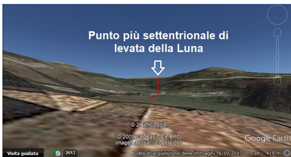
Figura 6: Simulazione con Google Earth del punto di levata della luna.

In conclusione, in questo articolo abbiamo discusso le possibili orientazioni astronomiche relative a sole e luna dell'Abbazia di Vezzolano. Abbiamo anche mostrato un metodo che usa software come SunCalc, MoonCalc e Google Earth, per determinare azimut e altezza del sorgere del sole e della luna, rispetto