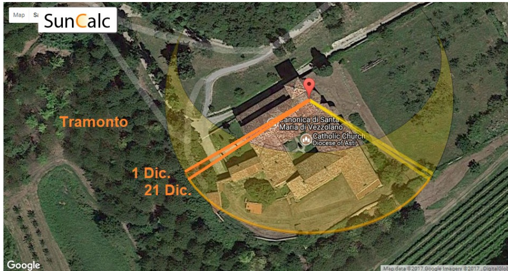
Figura 1: Il software SunCalc.net ci permette di vedere la direzione del sorgere e del tramontare del sole per ogni giorno dell'anno. L'immagine è ottenuta con due screenshots sovrapposti per il primo Dicembre ed il 21 Dicembre.