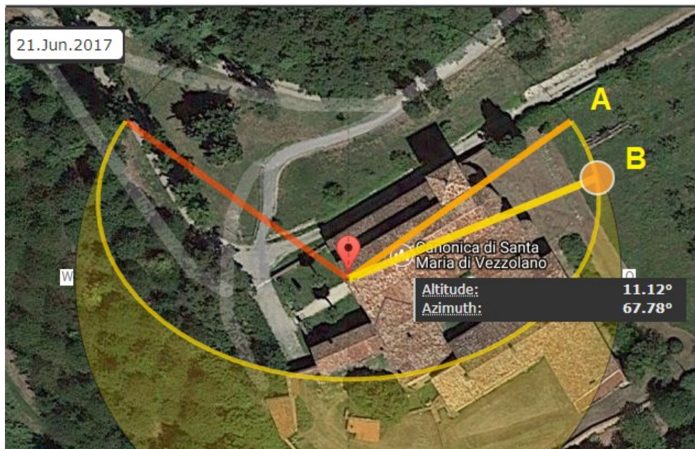
Figura 4: Simulazione al solstizio d'estate di quando è possibile vedere dall'Abbazia, il sole levarsi sopra l'orizzonte fisico (A è la direzione rispetto all'orizzonte astronomico, B è la direzione rispetto all'orizzonte fisico). Per essere visibile il sole deve avere un'altezza di circa 11 gradi sull'orizzonte astronomico. L'azimut del sole non coincide con l'asse della chiesa.

Ci rimane ancora un'ipotesi da analizzare e questa ipotesi riguarda la luna e i suoi lunistizi. La situazione che ci interessa capita quando la luna può sorgere nella direzione più settentrionale possibile (lunistizio estremo superiore o lunistizio settentrionale maggiore, come in Inglese, northernmost major lunar standstill) [13-15]. Ricordiamo brevemente che il moto apparente della luna è più complesso di quello del sole. Mentre il sole ha un ciclo annuale durante il quale passa dall'altezza più bassa sull'orizzonte (solstizio d'inverso) a quella più alta nel cielo (solstizio d'estate), la luna ha un ciclo di questo tipo in un mese lunare. Così essa ha un azimut (direzione) di levata che passa da Sud a Nord in 14 giorni circa e da Nord a Sud negli altri 14 giorni. Ma la luna ha anche un ciclo molto più lungo, di circa 18.6 anni, che è il ciclo relativo ai lunistizi, che vede cambiare il range (ampiezza) dell'azimut di levata (e tramonto) della luna da un valore minimo (lunistizio minore), ad un valore massimo (lunistizio maggiore). Quindi, quando si avrà un lunistizio maggiore, la luna avrà i punti di levata più settentrionale e più meridionale possibili (stessa cosa per il tramonto). Le direzioni di levata e tramonto del sole ai solstizi sono comprese tra quelle della luna ai lunistizi maggiori e minori.