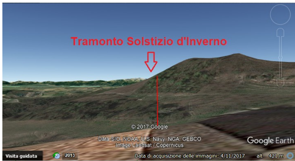
Figura 2: Il territorio circostante, visto verso la direzione del tramonto al solstizio d'inverso, grazie a Google Earth.

Oltre all'orientazione verso il tramonto o all'orientazione suggerita da Vitruvio, ci possono però essere altre orientazioni. La chiesa ha l'abside che si trova verso oriente. La chiesa potrebbe allora essere stata orientata verso il sorgere del sole, simbolo di rinascita in Cristo [6,7]. Come si può leggere in [6], nelle antiche Costituzioni Apostoliche si prescriveva che la chiesa fosse una struttura allungata, quasi a forma di nave, orientata verso il sorgere del sole: "Aedes sit oblonga, ad orientem versa, et quae sit navi similis". La fondazione della chiesa iniziava il giorno o la vigilia della festa del santo a cui era dedicata. Si vegliava la notte e al sorgere del sole l'asse della chiesa veniva tracciato nella direzione corrispondente. Questo tipo di rituale, in effetti, è molto antico ed esisteva già presso i popoli italici ed in particolare presso i Romani, che lo usavano per orientare la via principale delle città di loro fondazione o